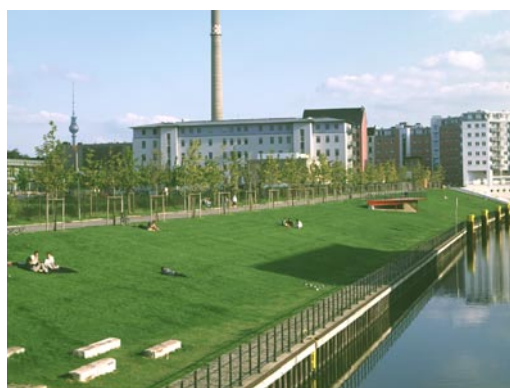
Долина Вулеталь – часть зеленой системы, центр будущих компенсационных мероприятий