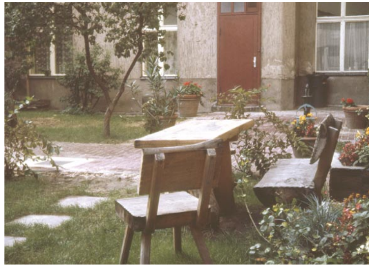
Озеленение дворов на Бисмаркштрассе Управление Сенате по городскому развитию