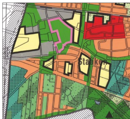
Четыре программных плана LaPro Связь между двумя планами – Изменения в пользовании землей показаны в программу LaPro (черная окантовка)