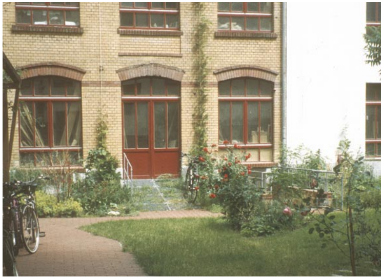
В качестве компенсации удалось выделить площадки для озеленения Управление Сенате по городскому развитию