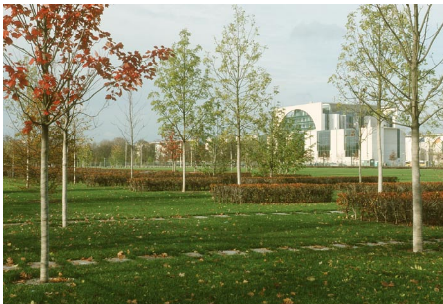
Площадь Республики: Зеленые зоны в правительственном квартале

необходимо для развития зеленых и свободных пространств, оно должно наметить перспективные решения. В концепции городского развития (STEK 2020) Берлин называет три приоритетных направления в области планирования ландшафтов и открытых пространств. Они должны обсуждаться в политических кругах, что придаст им большее значение. Предусмотрены следующие пункты: - Концепция адаптации, - Концентрация на ликвидации пробелов вдоль 20 Зеленых магистралей через Берлин с привлечением тематики биотопного союза и - Стратегии для временного "зеленого" промежуточного использования.