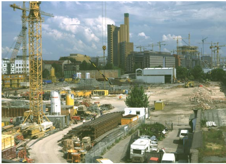
Рельсовый треугольник на Потсдамер Платц