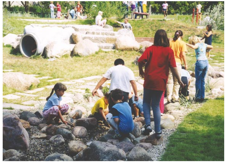
Наша зеленая школа - „Grün macht Schule“ Управление Сенате по делам труда и женщин

проходить не за счет будущих поколений. Такие ключевые слова как „стабильность, преемственность“, „сохранение биологического многообразия“, „Genius Loci“ и т.п. все чаще становятся на повестку дня. Как развивалось ландшафтное планирование конкретно в Берлине со времени первого появления программы LaPro? Что было тогда инновационным? Что особенным? Что оправдалось и что понадобится в будущем? Эти вопросы рассматриваются в данной статье.