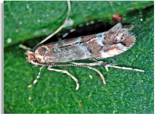
Abb. 1: Erwachsene Kastanienminiermotte

Die Rosskastanienminiermotte (Abb. 1), Cameraria ohridella , ist ein etwa 5 mm kleiner Schmetterling, der zur Familie der Blatttütentmotten ( Gracillariidae ) gehört. Die kupferfarbenen Vorderflügel tragen weiße, außen schwarz gerandete Querbinden. Obwohl die Falter flugfähig sind, fliegen sie aktiv nur kurze Strecken. Der leichte Körperbau und die fransigen Hinterflügel ermöglichen dem Tier jedoch ein Schweben in der Luft, sodass die Falter passiv mit dem Wind auch größere Distanzen überwinden können. Neben dem Wind, der die Miniermotte verdriftet, wird die Verbreitung in erster Linie durch den Menschen selbst über Reise- und Transportwege (LKW, Bahn, Schiff) verursacht bzw. beschleunigt. In Berlin wurde die Kastanienminiermotte erstmals 1998 nachgewiesen.