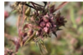
4 Junge Früchte im Fruchtstand