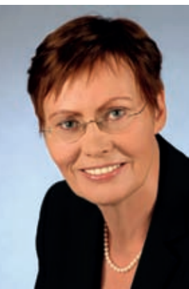
Ingeborg Junge-Reyer Senatorin für Stadtentwicklung