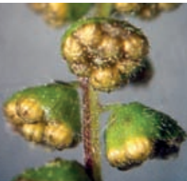
8 Männliche Blütenköpfe