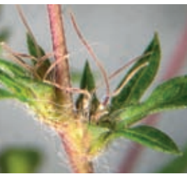
9 Weiblicher Blütenstand