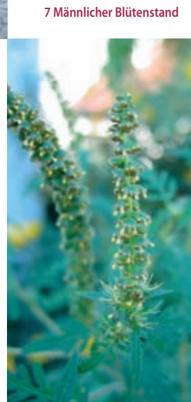
7 Männlicher Blütenstand