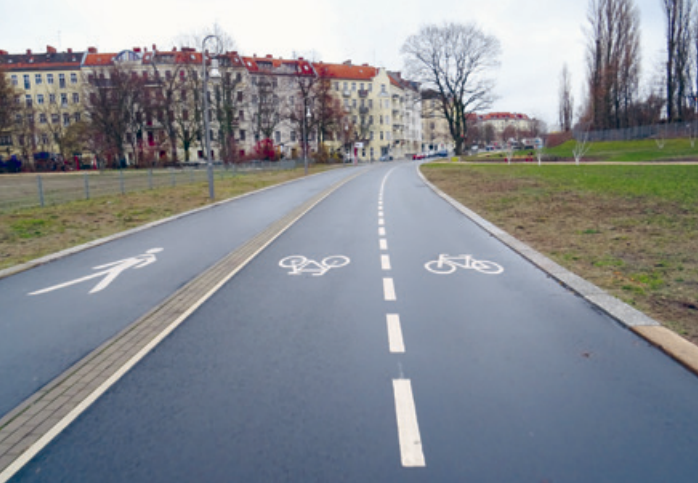
Torgauer Straße