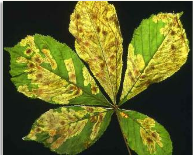
Abb. 2: Schadbild der Kastanienminiermotte

Die beiden darauf folgenden Stadien sind nicht mehr zur Nahrungsaufnahme befähigt, sie kleiden den Minenboden mit einem Gespinnst aus bzw. fertigen einen linsenförmigen Kokon an, in dem die Verpuppung stattfindet. Die Larvenentwicklung dauert insgesamt ungefähr einen Monat, je nach Witterungsbedingungen verlängert oder verkürzt sich die Entwicklungszeit um bis zu zehn Tage. Die anschließende Puppenruhe dauert ca.