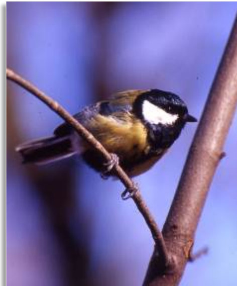
Abb. 5: Meise

In Europa konnten bisher keine spezifischen natürlichen Gegenspieler der Kastanienminiermotte nachgewiesen werden. Untersuchungen belegen, dass die Larven und Puppen von C. ohridella von heimischen allesfressenden (polyphagen) Gegenspielern gefressen oder parasitiert werden. Europaweit sind über 35 parasitische Wespenarten bekannt, die die Kastanienminiermotte als Wirt zeitweise nutzen (Abb. 4). Auch Räuber aus der Gruppe der Ameisen und Heuschrecken sowie Vögel (insbesondere Meisen-Arten (Abb. 5)) nutzen begrenzt Larven und Puppen der Kastanienminiermotte für ihre Ernährung. Insgesamt ist der Grad der Dezimierung jedoch nur sehr gering, er schwankt an den untersuchten Standorten zwischen 0,5 und 12%, sodass die hohe Populationsdichte der Kastanienminiermotte damit nicht nachhaltig und dauerhaft reduziert werden kann.