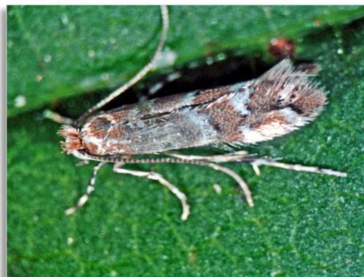
Abb. 1: Erwachsene Kastanienminiermotte

Die Rosskastanienminiermotte (Abb. 1), Cameraria ohridella , ist ein etwa 5 mm kleiner Schmetterling, der zur Familie der Blatttütentmotten ( Gracillariidae ) gehört. Die kupferfarbenen Vorderflügel tragen weiße, außen schwarz gerandete Querbinden. Obwohl die Falter flugfähig sind, fliegen sie aktiv nur kurze Strecken. Der leichte Körperbau und die fransigen Hinterflügel ermöglichen dem Tier jedoch ein Schweben in der Luft, sodass die Falter passiv mit dem Wind auch größere Distanzen überwinden können. Neben dem Wind, der die Miniermotte verdriftet, wird die Verbreitung in erster Linie durch den Menschen selbst über Reise- und Transportwege (LKW, Bahn, Schiff) verursacht bzw. beschleunigt. In Berlin wurde die Kastanienminiermotte erstmals 1998 nachgewiesen.