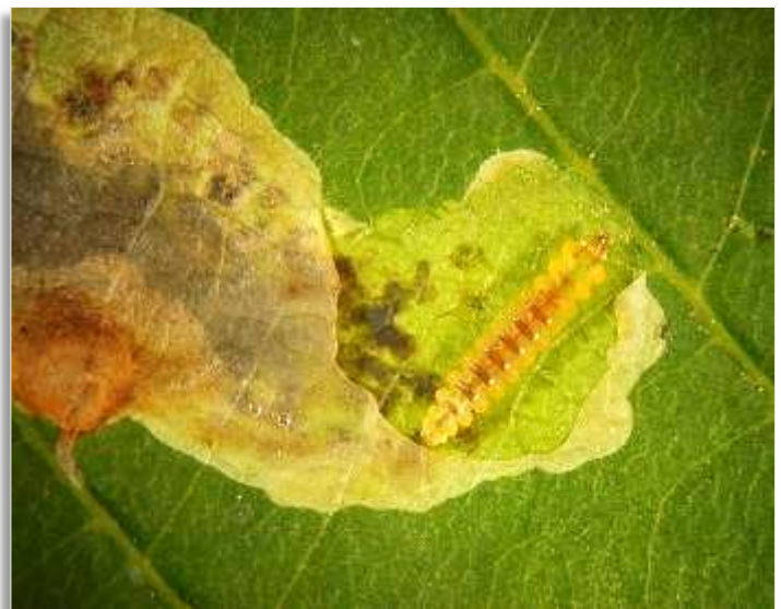
Abb. 3: Larve der Kastanienminiermotte in einer Blattmine