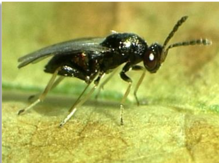
Abb. 4: Schlupfwespe Pnigalio agraulis