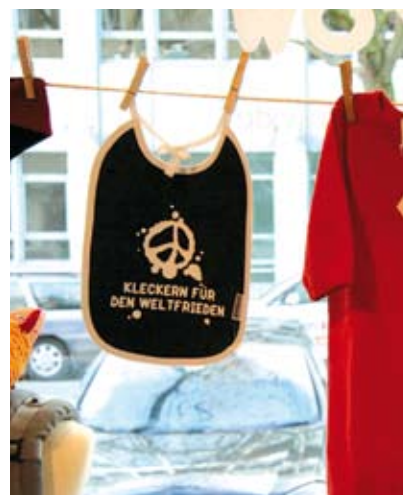
hug and grow