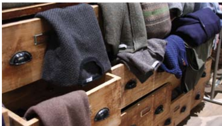
BREAD & BUTTER

„Viele junge Designer teilen heute die Visionen und Ideen ihrer avantgardistischen Vordenker der Eco-Bewegung. Gerade für die jungen Wilden sind funktionierende und kompetente Netzwerke überlebenswichtig. Plattformen wie THEKEY.TO oder CREATE BERLIN geben der Design- und Modeszene einen angemessenen und einzigartigen, somit wahrnehmbaren Rahmen.“