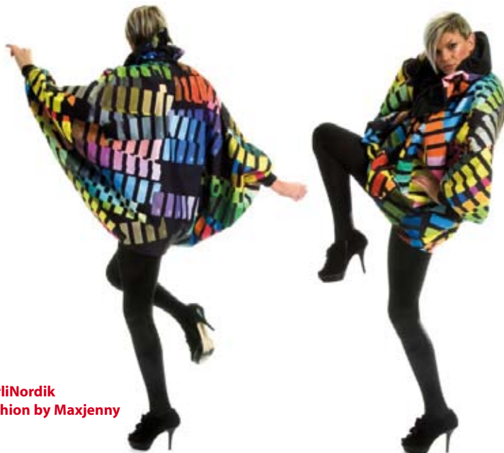
BerliNordik Fashion by Maxjenny

Mit der Erkenntnis, dass eine gemeinsam getragene Initiative die Effekte multipliziert, werden aktuell Energien und Ressourcen stärker denn je gebündelt.