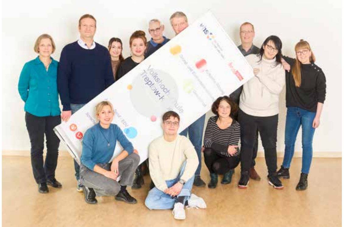
Team der Volkshochschule Treptow-Köpenick