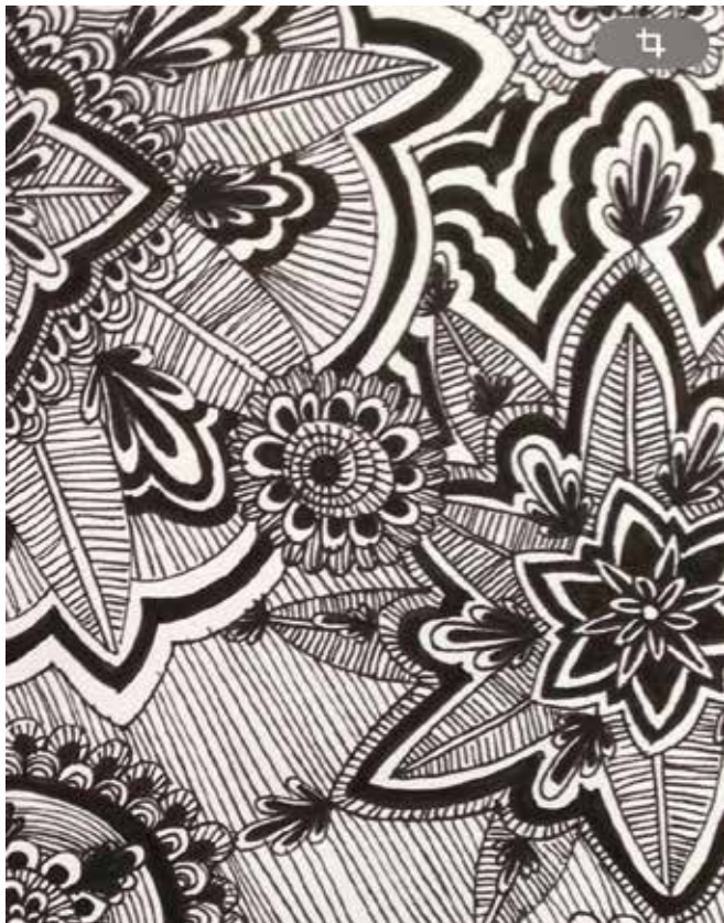
Exemplarisches meditatives Musterbild zum Kurs TK-2601-H

TK-2601-H Evelyn Höfs 1 11.-12.10.25, Sa+So, 11.00-15.00 Uhr, 2x, 10 UE 🏠 VHS, Baumschulenstraße 79 € 44,00 € (ermäßigt 24,00 €)