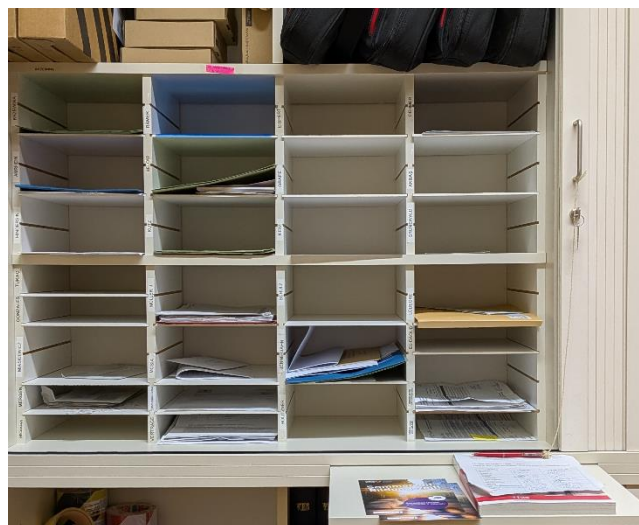
Bei Licht besehen doch nicht so finster

Wenn ich gut war, gibt's die Auszeichnung: Stempel, Kreuzchen, Datum, Unterschrift. Zack.