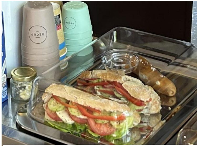
Sieht gut aus! Bistro Karli

Wenn Sie an der VHS-Lehrstätte in der Karlsgartenstraße 6 unterrichten, kennen Sie es vielleicht schon: das neue Bistro „Karli“. Schnaufen Sie hier bei leckeren Snacks und Getränken kurz durch oder nutzen Sie den Ort für den Schnack zwischendurch. Der Weg vom Kursraum ist kurz! Ein kleiner Ausblick: Bald müssen Sie nicht mehr stehen ... .