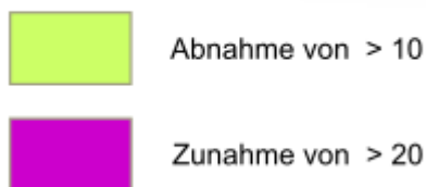
Abb. 3: Veränderungsdarstellung der Einwohnerdichte zwischen 2022 und 2023

Dabei verteilen sich die Bereiche mit größeren Veränderungen der Werte der Einwohnerdichte (Ew/ha) binnen Jahresfrist – hier definiert als Zunahmen um mehr als 20 bzw. Abnahmen um mehr als 10 Personen je ha – nicht gleichmäßig über die einzelnen Bezirke bzw. über die Stadtfläche, sondern es lässt sich ein Schwerpunkt im Bereich der Innenstadt (Bereich der Umweltzone innerhalb des Inneren-S-Bahn-Ringes) feststellen: