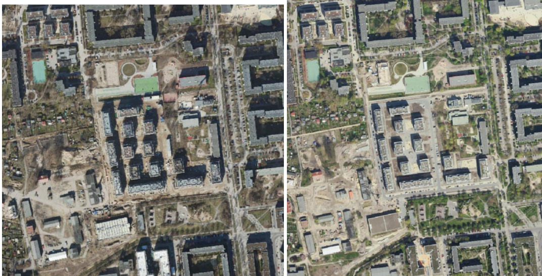
Abb. 4: Zunahme der Einwohnerdichte (Ew/ha) um knapp 400 und 100 Personen in zwei Wohnblöcken zwischen 2022 und 2023 durch Neubaumaßnahmen im Stadtgut Hellersdorf, Quelle der Luftbilder: Geoportal Berlin

Insgesamt muss beachtet werden, dass eine Veränderungskartierung zusätzlich über einen längeren Zeitraum betrachtet werden muss, so dass die Entwicklung hier in den nächsten Jahren fortgeführt und jährlich aktualisiert werden soll.