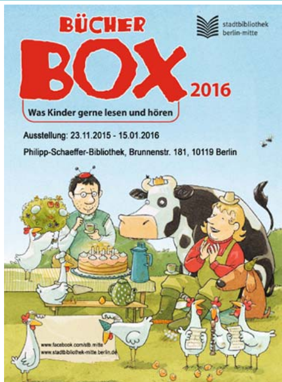
Bücherbox 2016

Die Broschüre ist in allen Bibliotheken des Bezirkes Mitte und in vielen Buchhandlungen kostenfrei erhältlich.