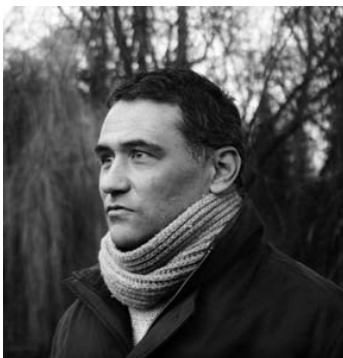
Christian Buder ©privat

Informationen zum Gesamtprogramm unter: lange-nacht-des-buches.de / Alle Veranstaltungen: Eintritt frei