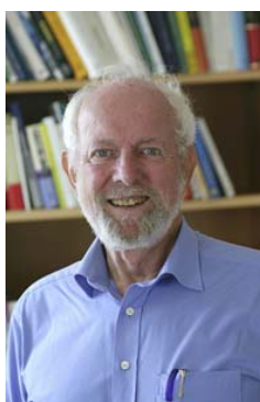
Prof. E. U. von Weizsäcker