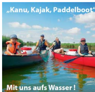
Thomas Kettler Verlag Conrad Stein Verlag Jübermann-Verlag präsentieren aktuelle Bücher und Karten

www.thomas-kettler-verlag.de www.juebermann.de www.conrad-stein-verlag.de