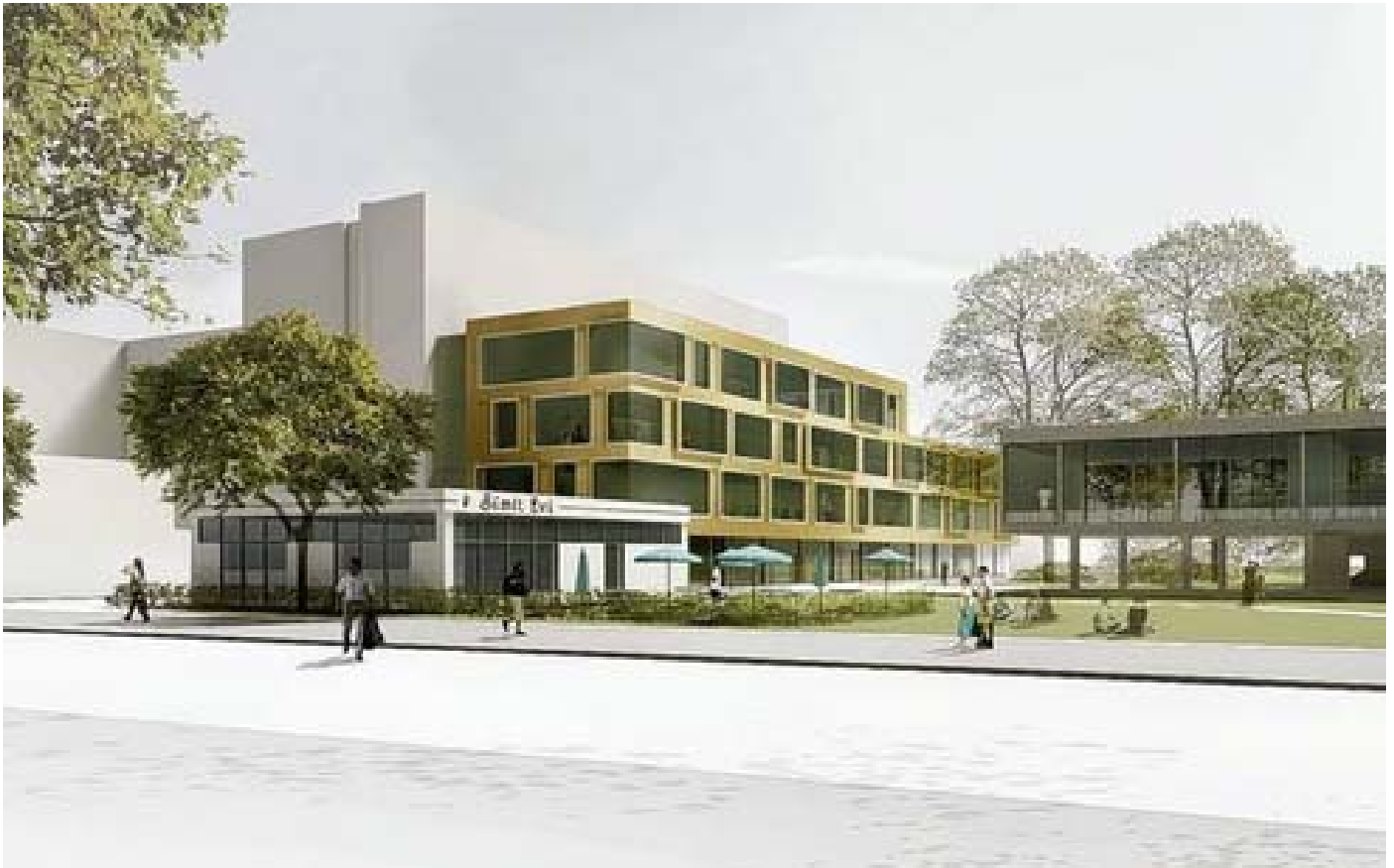
Die neue Mittelpunktbibliothek ©AV1 Architekten

Die Bibliothek eröffnet voraussichtlich am Montag, den 29.06.2015 mit einem bunten Programm mit Lesungen, Führungen und einer Ausstellung des Carlsen Verlages.