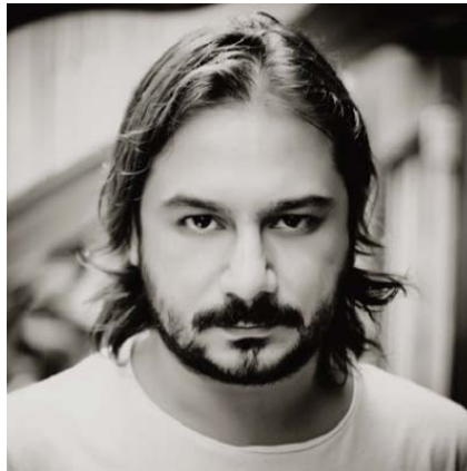
Emrah Serbes

Ein junger Mann schreibt eine Enzyklopädie der Gefühle, von leicht bis unerträglich, die unbedingt von hinten zu lesen ist; ein anderer verschwindet langsam – mit jedem Menschen, der aus seinem Leben tritt, ein Stückchen mehr; alte Fotos erzählen die Geschichte eines Sommers, aber hat das, woran wir uns erinnern, jemals wirklich existiert?