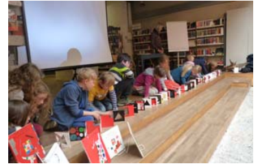
Květa Pacovská (2014)