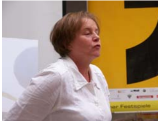
Jutta Bauer(2010)

Impressionen aus Veranstaltungen mit Jutta Bauer, Květa Pacovská , Aino Havukainen und Sami Toivonen in der Stadtbibliothek Berlin-Mitte