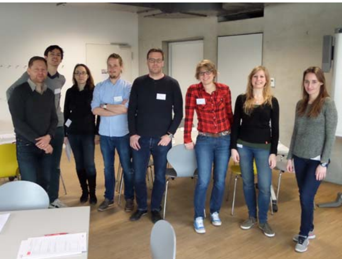
Die Verlagsmitarbeiter_innen aus München

Vom 6.02.2017 - 31.03.2017 präsentierte der Stark Verlag sein Verlagsprogramm im Foyer der Schiller-Bibliothek.