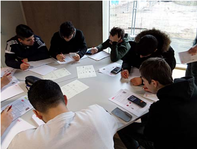
Schüler der 10. Klasse der Ernst-Schering-Oberschule

Den motivierten und eifrigen Schülerinnen und Schülern gelang es, die zahlreichen Aufgaben der verschiedenen Themengebiete in den gegebenen 90 Minuten zu lösen, wobei auch die verteilten Formelsammlungen hilfreich waren.