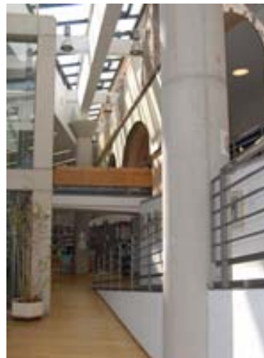
Bibliothek am Luisenbad

In der Bibliothek am Luisenbad kann man ab sofort nicht nur 133.000 Medien, sondern auch einen verborgenen Schatz finden. Dieser ist Teil der weltweit beliebten GPS-Schnitzeljagd Geocaching. Wer mitmachen will, erhält auf der Internetplattform www.geocaching.de unter dem Eintrag „Luise cacht“ die Startkoordinaten und kann sich dann durch die Bibliothek suchen.