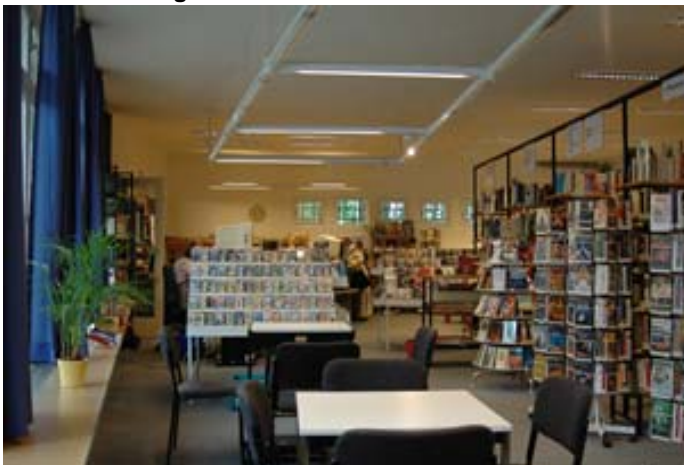
Bibliothek Tiergarten-Süd