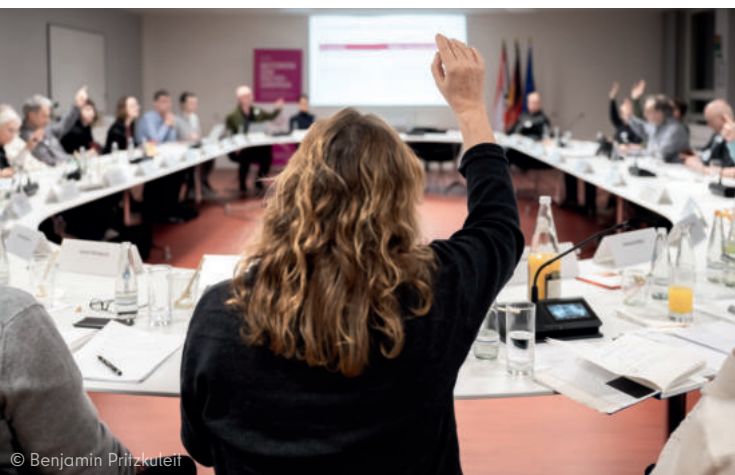
Abstimmungsrunde im Plenum

Das Netzwerk hat sich in kurzer Zeit als anerkanntes und geachtetes Austauschforum etabliert. Die Mitglieder des Netzwerks und die Vertreterinnen und Vertreter der landeseigenen Wohnungsunternehmen als Gäste schätzen die Teilnahme an den Sitzungen und erleben den Austausch als bereichernd. Die Gastrolle der Unternehmen hat sich inhaltlich bewährt und soll beibehalten werden. Als wertschätzend wurde die Teilnahme weiterer Unternehmensvertreterinnen und -vertreter über die vereinbarten zwei Personen hinaus empfunden, da sie den inhaltlichen Austausch sowie den Vergleich der Unternehmen zusätzlich bereicherte. Der grundsätzlich respektvolle und konstruktive Austausch – auch dank professioneller Moderation – ermöglicht es, dass auch potenziell konfliktrichtige Themen aufgegriffen und gewinnbringend diskutiert werden können.