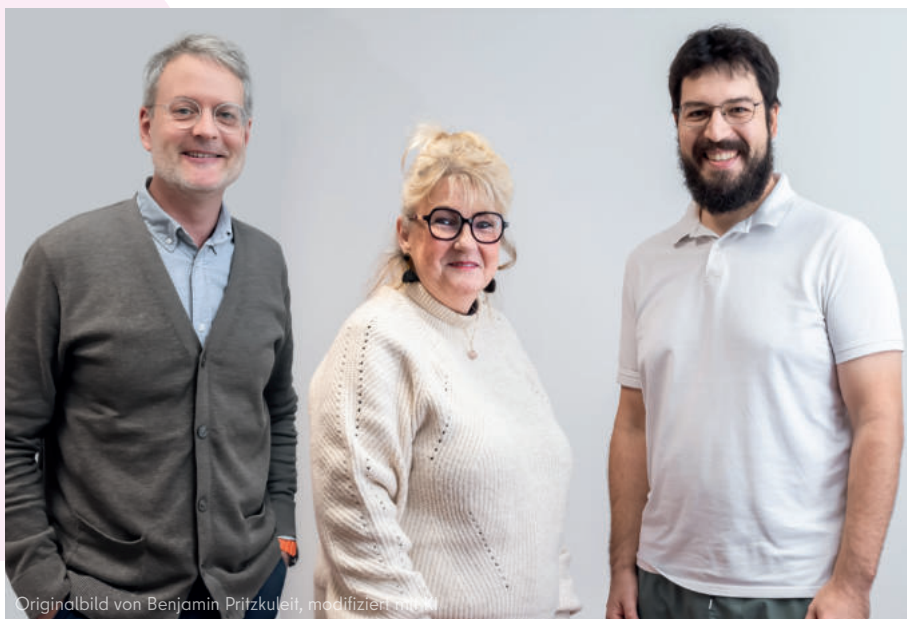
Originalbild von Benjamin Pritzkeleit, modifiziert mit