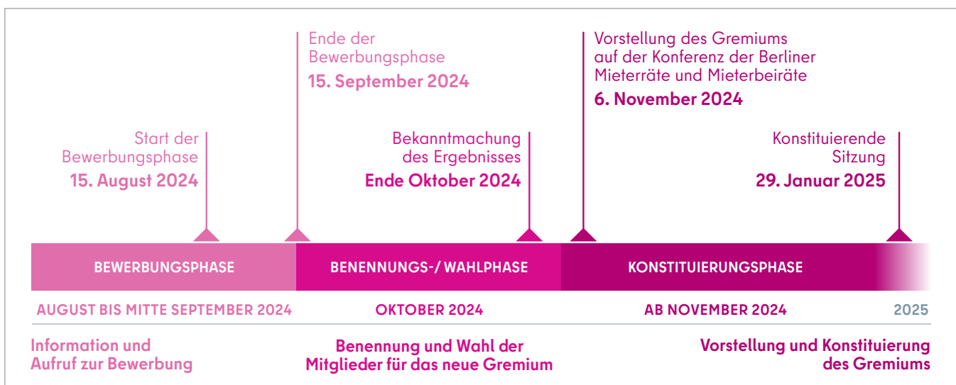
Zeitlicher Ablauf des Besetzungsverfahrens (eigene Darstellung)

Die Mieterräte benannten jeweils eigenständig ein Mitglied sowie eine Stellvertretung für das Netzwerk. Die Benennung erfolgte innerhalb der bestehenden Mieterratsstrukturen, bspw. durch Wahl oder Akklamation, und wurde protokolliert. Die Mitglieder der Mieterbeiräte wiederum konnten sich aktiv zur Wahl