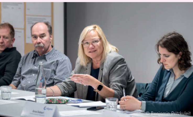
Gäste aus den Wohnungsunternehmen bei der 4. Sitzung

Gemeinsam verfasster Beitrag aller landeseigenen Wohnungsunternehmen