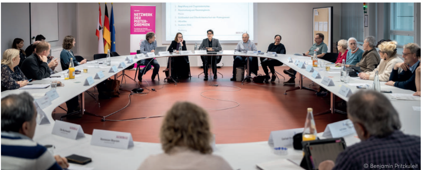
Austausch im Plenum

Die Themen, die die Arbeit des Netzwerks im Jahr 2025 geprägt haben, lassen sich in drei zentrale Themenfelder einordnen: Räumlichkeiten, Sichtbarkeit und Zusammenarbeit.