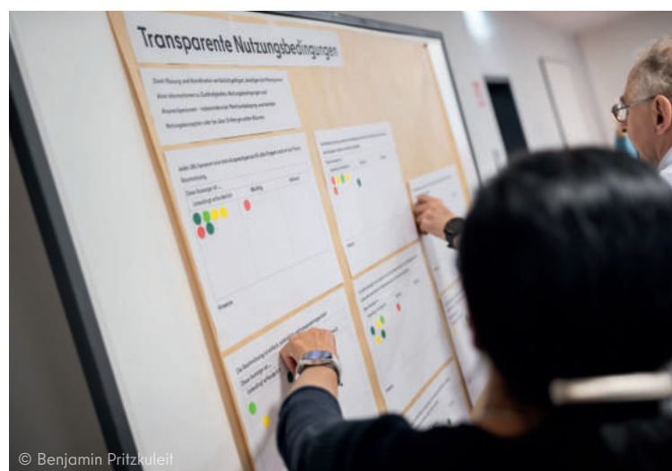
Abstimmung zu Nutzungsbedingungen von Räumen

Für den zukünftigen Umgang und als Zwischenergebnis zum Thema Raumnutzung wurden im Netzwerk Bausteine für Leitlinien zur Raumnutzung erarbeitet und abgestimmt. Diese bilden eine gute Grundlage für den weiterführenden Austausch. Die SiWo wird die Mietergremien in diesem Zusammenhang weiter unterstützen und die Leitlinien im Austausch mit den landeseigenen Wohnungsunternehmen konkretisieren.