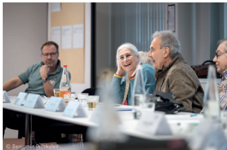
Austausch der Netzwerkmitglieder im Plenum

und verstärken sich gegenseitig. Die Einbindung der landeseigenen Wohnungsunternehmen ist Bedingung für tragfähige Lösungen.