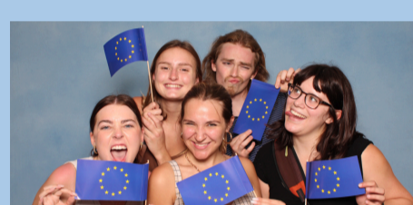
Teilnehmende des Demokratiefestes machen Fotos mit der Selfiebox am Stand der EU-Strukturfonds

Demokratiefest der Bundesregierung: Der ESF+ im Land Berlin war dabei!