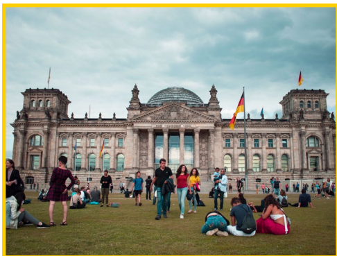
Reichstagsgebäude im sommerlichen Berlin

Sonnige Sommertage wünscht Ihnen der ESF Berlin.