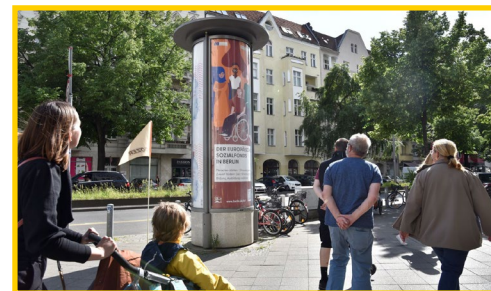
Der ESF Berlin prägt das Stadtbild

Wenn Sie in letzter Zeit in Berlin unterwegs waren, ist Ihnen vielleicht unsere Straßenlandwerbung ins Auge gefallen: Die ESF-Familie präsentierte sich in typischer Berliner Vielfalt vom 23. bis 29. Mai 2022 im gesamten Stadtgebiet.