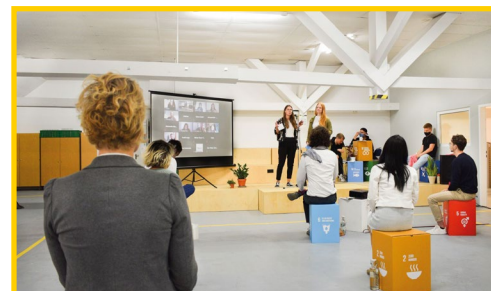
Gründerinnen und Gründer des Soulincubator II teilen ihre Erfahrungen

Aus den Bewerbungen wurden Gründende mit den besten Ideen durch eine Jury ausgewählt. Die Gründenden durften dann an einer sechs-monatigen Inkubationsphase teilnehmen, die unter anderem intensive Coachings bzw. Fortbildungen sowie eine Stipendiumsförderung beinhaltet. Das Ziel ist es dabei, die Grundsteine für den Erfolg des eigenen Unternehmens zu legen.