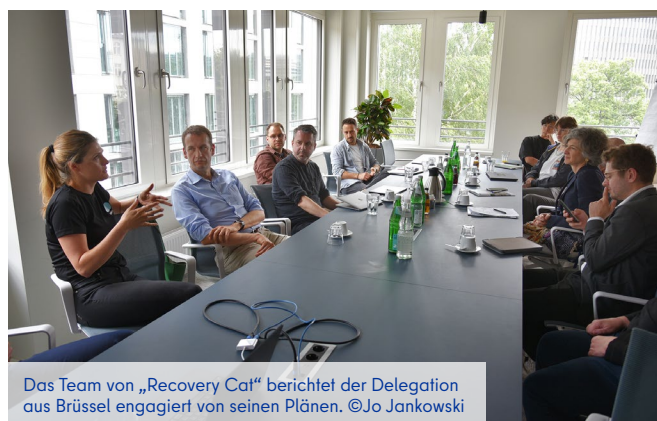
Das Team von „Recovery Cat“ berichtet der Delegation aus Brüssel engagiert von seinen Plänen.