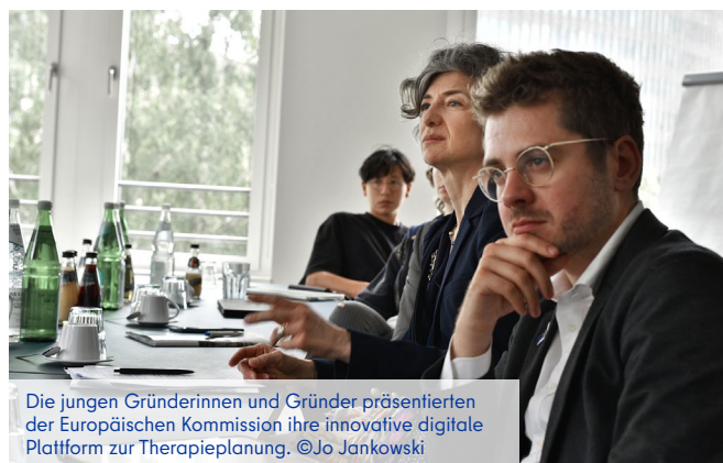
Die jungen Gründerinnen und Gründer präsentierten der Europäischen Kommission ihre innovative digitale Plattform zur Therapieplanung.