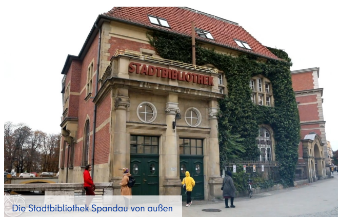
Die Stadtbibliothek Spandau von außen