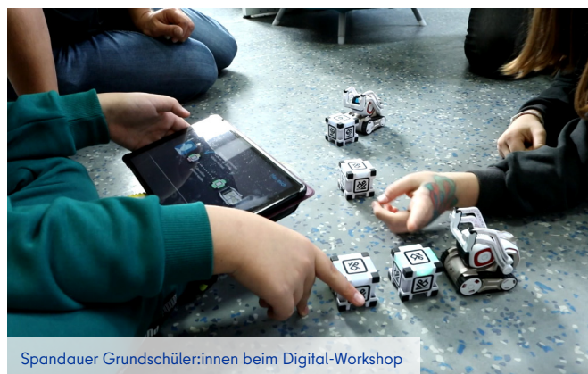
Spandauer Grundschüler:innen beim Digital-Workshop