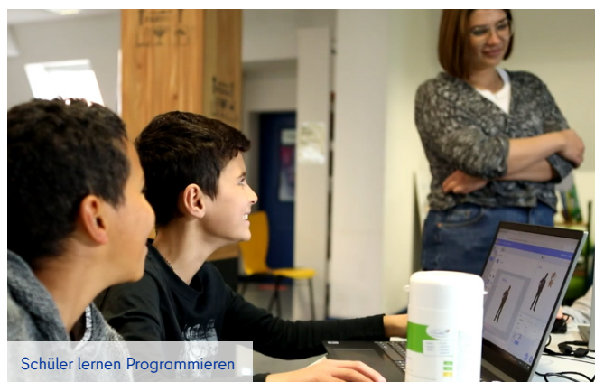
Schüler lernen Programmieren