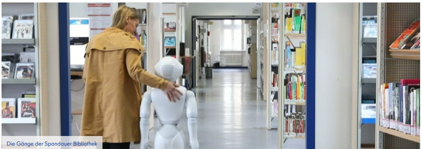
Die Gänge der Spandauer Bibliothek

Das EFRE-finanzierte Projekt „Digital-Lokal“ ist Teil der Zukunftsinitiative Stadtteil ZIS II und hat zum Ziel, attraktive Bildungsangebote in sozial benachteiligten Quartieren zu fördern. „Digital Lokal“ trägt zur Unterstützung der Medienkompetenz und der Integration der Bürgerinnen und Bürger in Spandau bei.