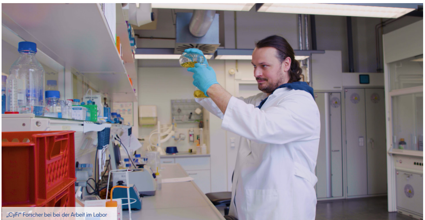
„CyFi“ Forscher bei der Arbeit im Labor