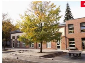
Reginhard Grundschule Reinickendorf Ständig nass und wenig Spielgeräte: Der Schulhof der Reginhard Grundschule in Reinickendorf bot den Schülerinnen und Schülern kaum Erholung. Dank EU-Förderung verdient er nun den Namen „Pausenort“. Weitere Informationen →