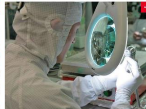
Kunsterzen aus Lankwitz für Kleinkinder Wenn das Herz nicht mehr richtig schlägt, braucht es Unterstützung. Für Erwachsene gibt es erprobte Produkte, doch die eigenen sich nicht für Kinder. Das ändert die Berlin Heart GmbH mit ihrer Forschung. Weitere Informationen →