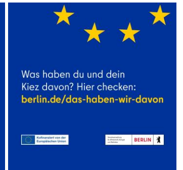
Social-Media-Posts für Partner