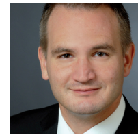
MANUEL MANG INTERAUTOMATION Deutschland GmbH

„Für die Entwicklung strategischer Kooperationen auf Netzwerk- und Cluster-Ebene sind Förderprogramme zur Internationalisierung der Wirtschaft essentiell. Mit der Innovationspolitik im Rahmen der gemeinsamen Innovationsstrategie der Länder Berlin und Brandenburg (innoBB) werden die Cluster länderübergreifend gefördert. Insbesondere kleine Unternehmen, denen häufig die Ressourcen für den Markteintritt in eine neue Region oder die Recherche zu potenziellen Kooperationspartnern in der Forschung und Entwicklung fehlen, können bei den ersten Internationalisierungsschritten Mehrwert aus diesen Kooperationen ziehen. Gibt es dann Ansätze zur Intensivierung der Internationalisierungsaktivitäten, bieten die Förderprogramme über ein breites Portfolio zur Förderung von Einzelmaßnahmen häufig ebenfalls die passende Unterstützung an.“