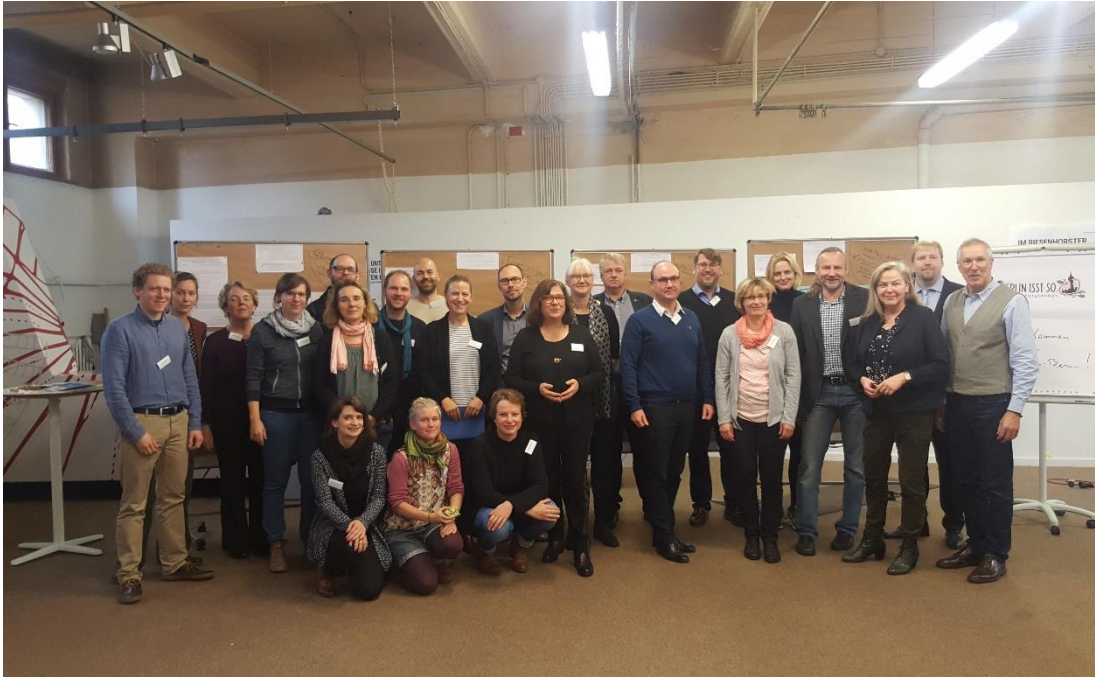
Abbildung 1: Die Teilnehmenden des Abschluss-Plenums am 09.11.2018.