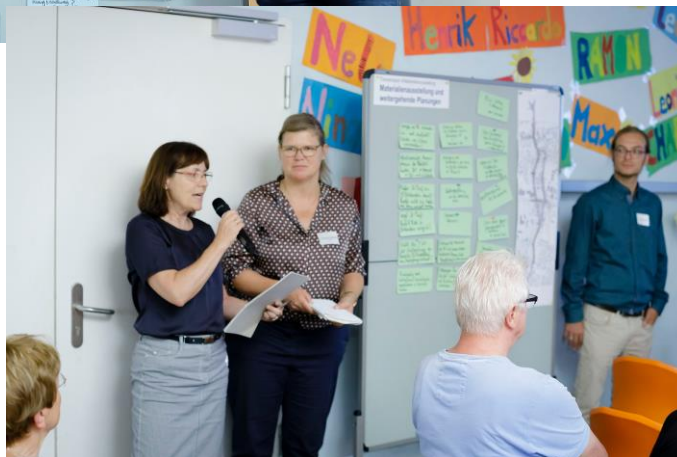
20:30-21:00 Uhr - Vorstellung der Ergebnisse im Plenum / Dank und Ausblick