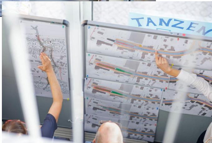
17:00-18:00 Uhr - Materialiensammlung