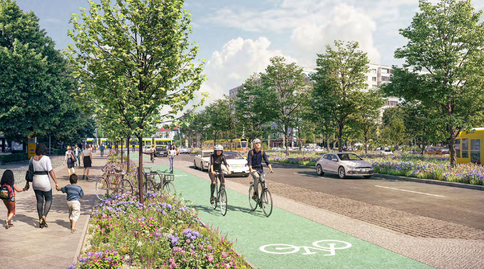
Die Visualisierung nach der Erneuerung