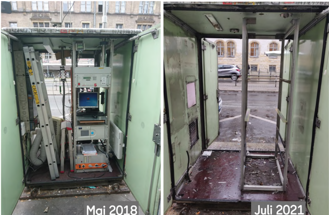
Abbildung 1: Innenansicht des MC220 in der Karl-Marx-Straße 76 im Betriebszustand im Mai 2018 (links) und nach dem Rückbau der Messeinrichtungen im Juli 2021 (rechts).

Die Standorte der automatischen Stationen des Berliner Luftgütemessnetzes sind der Tabelle 1 zu entnehmen. Die Messungen in der Karl-Marx-Straße 76 (MC220) werden ab Anfang Juli 2021 wegen Bauarbeiten über einen längeren Zeitraum wegfallen. Beinahe 30 Einsatzjahre waren dem Messcontainer deutlich anzusehen, so dass dieser durch einen neu beschafften Messcontainer ersetzt wurde. Eingesetzt wird der Nachfolger, der MC221, seit dem 08. Juni in der Karl-Marx-Straße 38. Gemessen werden, wie schon am MC220, Stickstoffoxide und Partikel der PM 10 - und der PM 2,5 -Fraktion. Abbildung 1 zeigt zwei Bilder vom Innenraum des MC220 vom Mai 2018 und vom Juli 2021. Zusätzlich zu den genannten Stationen werden seit Ende Februar 2020 Stickstoffoxide an der Forschungsmessstation MC014 in der Nähe der Stadtautobahn A100 gemessen. Die Daten aller automatischen Stationen sind im Internet unter https://luftdaten.berlin.de/ abrufbar. Die Beurteilung der gemessenen Immissionsbelastung erfolgt durch Vergleich mit den geltenden Grenz- und Zielwerten, welche in Tabelle 2 aufgelistet sind.