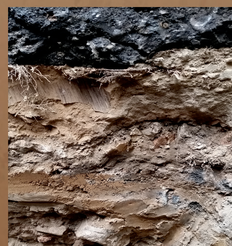
Abbildung 4: Versiegelter Boden