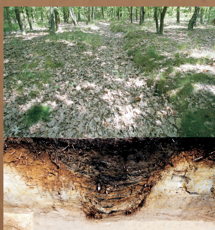
Abbildung 3: Schützengraben in Berlin

Böden sind vielfältigen Belastungen ausgesetzt. Direkte und indirekte Schadstoffeinträge, Bodenerosion, Bodenverdichtung und Versiegelung führen zu Veränderungen der Bodeneigenschaften und schränken die Funktionsfähigkeit der Böden ein (vergleiche Abbildung 4).