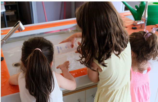
Forscherwoche Zukunftskiez Hellersdorf

Das Modellprojekt zielt auf die ressortübergreifend-kooperative Stärkung der Bildungslandschaften in benachteiligten Quartieren ab. Kernanliegen ist die Verbesserung der Mehrfachnutzung von Räumen und Freiflächen für Bildung und gemeinschaftsfördernde Zwecke. Alle bezirklichen Umsetzungsprojekte eint das Ziel, die Qualität der sozialräumlichen Kooperationen für Bildung zu steigern. Auch sollen niedrigschwellige Zugänge zu Bildungs- und bildungsunterstützenden Angeboten ausgeweitet und Verbesserungen in den Bereichen „Gestaltung der Übergänge entlang der Bildungslaufbahn“, „Elternarbeit“, „Sozialräumliche Öffnung von Schule“ und „(Bildungs-)Orte für Kinder und Jugendliche“ erreicht werden.