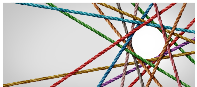
Gefördert wird die Koordinierung von Netzwerken für Bildung

Finanziert werden derzeit acht Zukunftskieze. Die Bezirke erhalten dafür seit 2023 Fördermittel der Senatsverwaltung für Bildung, Jugend und Familie (SenBJF) und seit Mai 2025 auch Mittel der Senatsverwaltung für Stadtentwicklung, Bauen und Wohnen (SenStadt) im Rahmen einer Förderung als Gemeinschaftsprojekt. Gesteuert werden die Projekte von Verantwortungsgemeinschaften, in denen die regionalen Schulaufsichten und verschiedene Fachämter (Jugend, Schule und Sport, Weiterbildung und Kultur, Sozialraumorientierte Planungskoordination (SPK)/Stadtplanung) zusammenwirken. Die Umsetzungsmittel werden von den Bezirken in der Regel an koordinierende Träger weitergeleitet, womit diese ressortübergreifend abgestimmte Maßnahmen umsetzen. Eine enge Kooperation besteht in jedem Zukunftskiez mit den Akteuren der non-formalen und der formalen Bildung, die für die Erreichung der gemeinsam festgelegten Ziele im Gebiet relevant sind, sowie mit dem örtlichen Quartiersmanagement-Team.