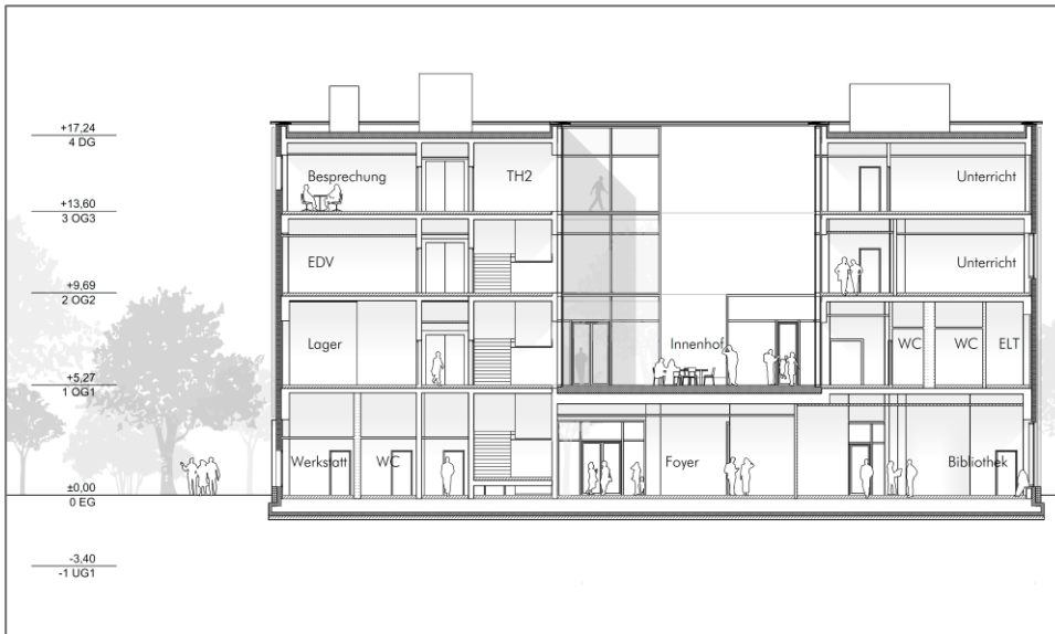
© karlundp Gesellschaft von Architekten mbH, Gebäudeschnitt

Für alle Nutzungen sind eigene fachspezifische Räume vorgesehen, die teilweise durch Übergänge miteinander verbunden sind. Alle Beteiligten können zusätzlich zwei multifunktionale Veranstaltungssäle, die durch flexible Elemente auch zu einem großen Raum zusammengelegt werden können, für eigene oder gemeinsame Aktivitäten nutzen. Auch nachbarschaftliche Initiativen sollen hiervon Gebrauch machen können. Die Außenflächen bieten weiteres Nutzungspotenzial für alle Bereiche. Im Foyer des BIZ sollen Mitarbeiter:innen aus allen beteiligten Fachbereichen die Besucher:innen empfangen. Hier können sie sich für alle Angebote anmelden, werden am Standort gelotst und können die Ausstellungen, Veranstaltungsinformationen und ein gastronomisches Angebot im Eingangsbereich des BIZ nutzen. Ein Kinderbetreuungsbereich wird Eltern die Möglichkeit geben, an Angeboten teilzunehmen. Ein Novum: Die Bibliothek soll auch an Wochenenden und in den Nachtstunden ohne betreuendes Personal über einen separaten Eingang und per Code zugänglich gemacht werden.