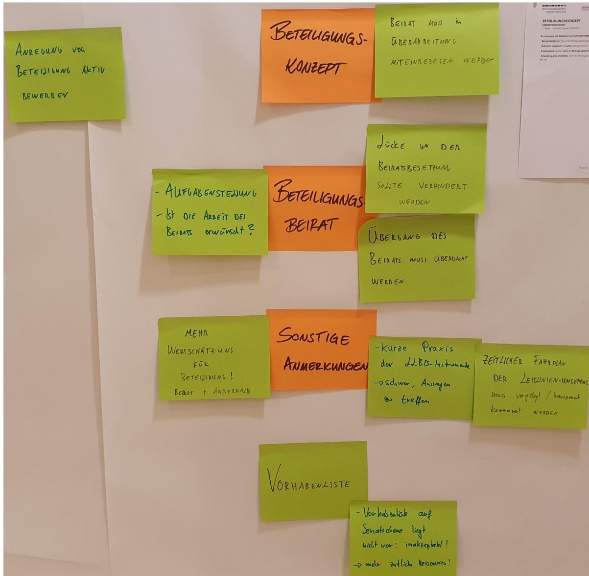
Abbildung 2: Fotodokumentation der Ergebnisse aus AG 2