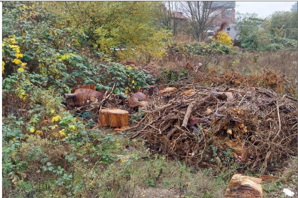
Abb. 2 - 8: Habitatpotenzialflächen im erweiterten Untersuchungsgebiet (Zauneidechse)