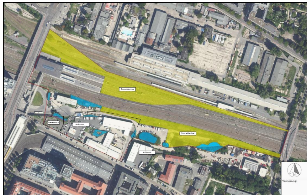
Abb. 1: Potenzialflächen für die B-Pläne V-67a/b VE; grün -Zauneidechse, blau – Vögel, lila - Fledermaus

Folglich sind die Potenzialflächen im Untersuchungsgebiet als Zauneidechsenhabitat zu betrachten.