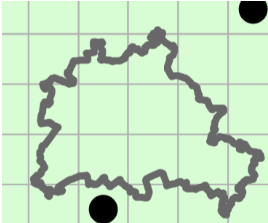
Abbildung 5: Kartenausschnitt der „kombinierten Vorkommens- und Verbreitungskarten der Pflanzen- und Tierarten der FFH-Richtlinie“ (BfN 2015) von Berlin. Ein schwarzer Punkt stellt ein nachgewiesenes Vorkommen dar, die grünen Felder verweisen auf ein Verbreitungsgebiet (von Hyla arborea ).