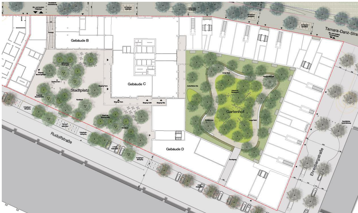
Abbildung 3: Vorhabensgebiet (rot) bebaut durch die Gebäudeteile B-D und einer Grünanlage

Aktuell besteht die Fläche aus einer vollversiegelten Stellplatzfläche und einigen gewerblich genutzten Gebäuden. Lediglich ein geringer Teil ist unversiegelt und von Vegetation bewachsen. Die Grünfläche (Gartenhof) wird voraussichtlich größer als die des aktuellen Bestands.