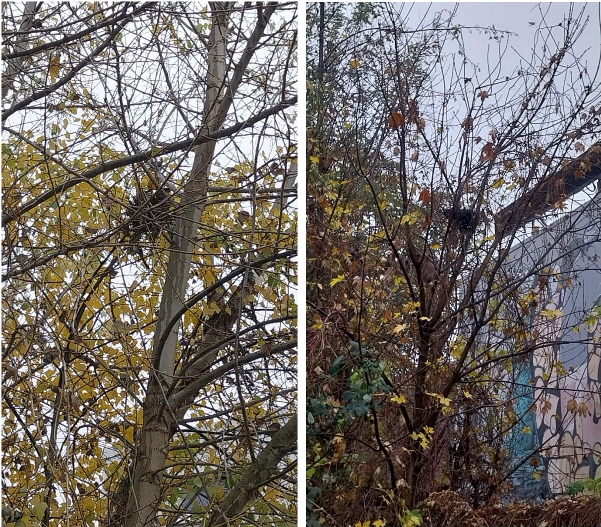
Abbildung 6: zwei Nester, dokumentiert auf der Begehung am 11.11.2025.

50 x 50 cm groß sein. Weiterhin kann sich an verschiedenen Leitfäden orientiert werden, wie z.B. am „Leitfaden für biodiversitätsfördernde Fassadenbegrünung“ des ILÖP der Universität Stuttgart (Institut für Landschaftsplanung und Ökologie 2024) oder „Grundlagen der Dachbegrünung“ des Verbands für Bauwerksbegrünung (VfB – Verband für Bauwerksbegrünung o.J.).