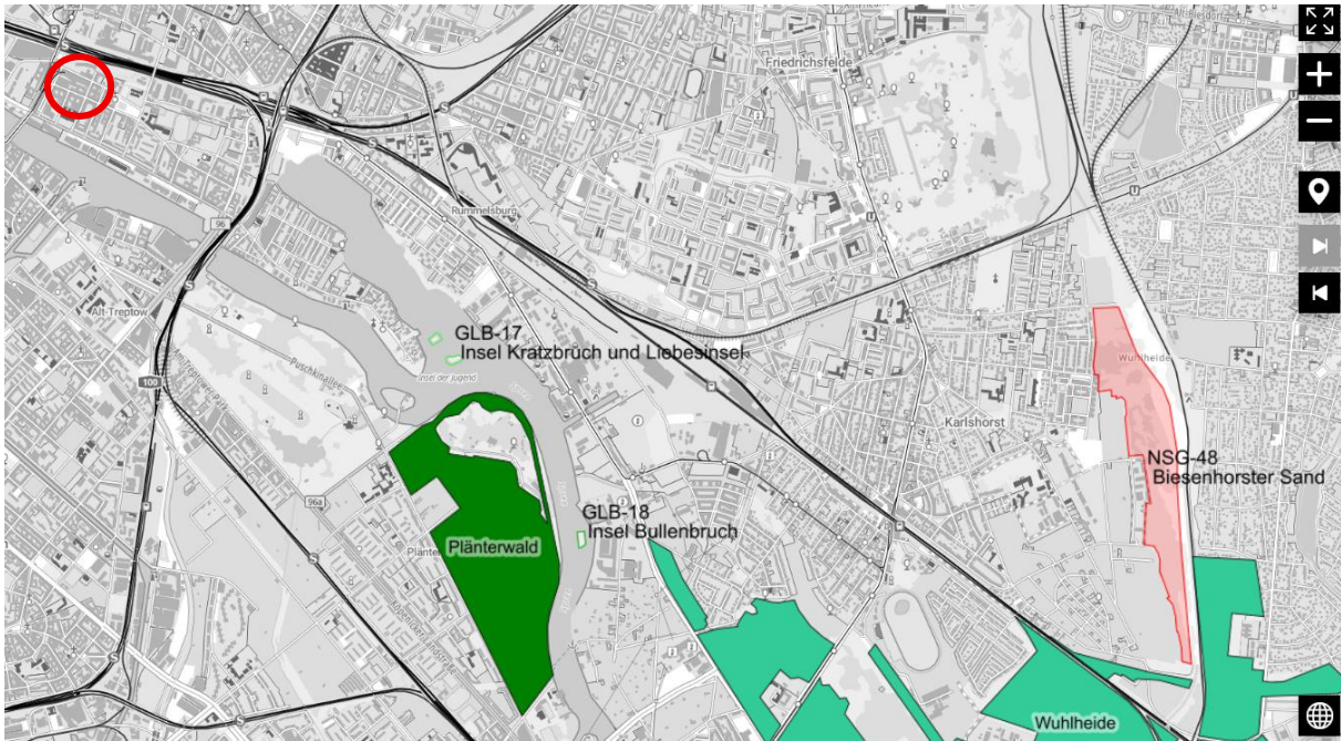
Abbildung 2: Vorhabengebiet (rot umrandet), LSG Plänterwald (grün flächig), LSG Wuhlheide (türkis), NSG Biesenhorster Sand (rot flächig), GLB Insel Kratzbrüch und Liebesinsel, GLB Insel Bullenbruch (grün umrandet)