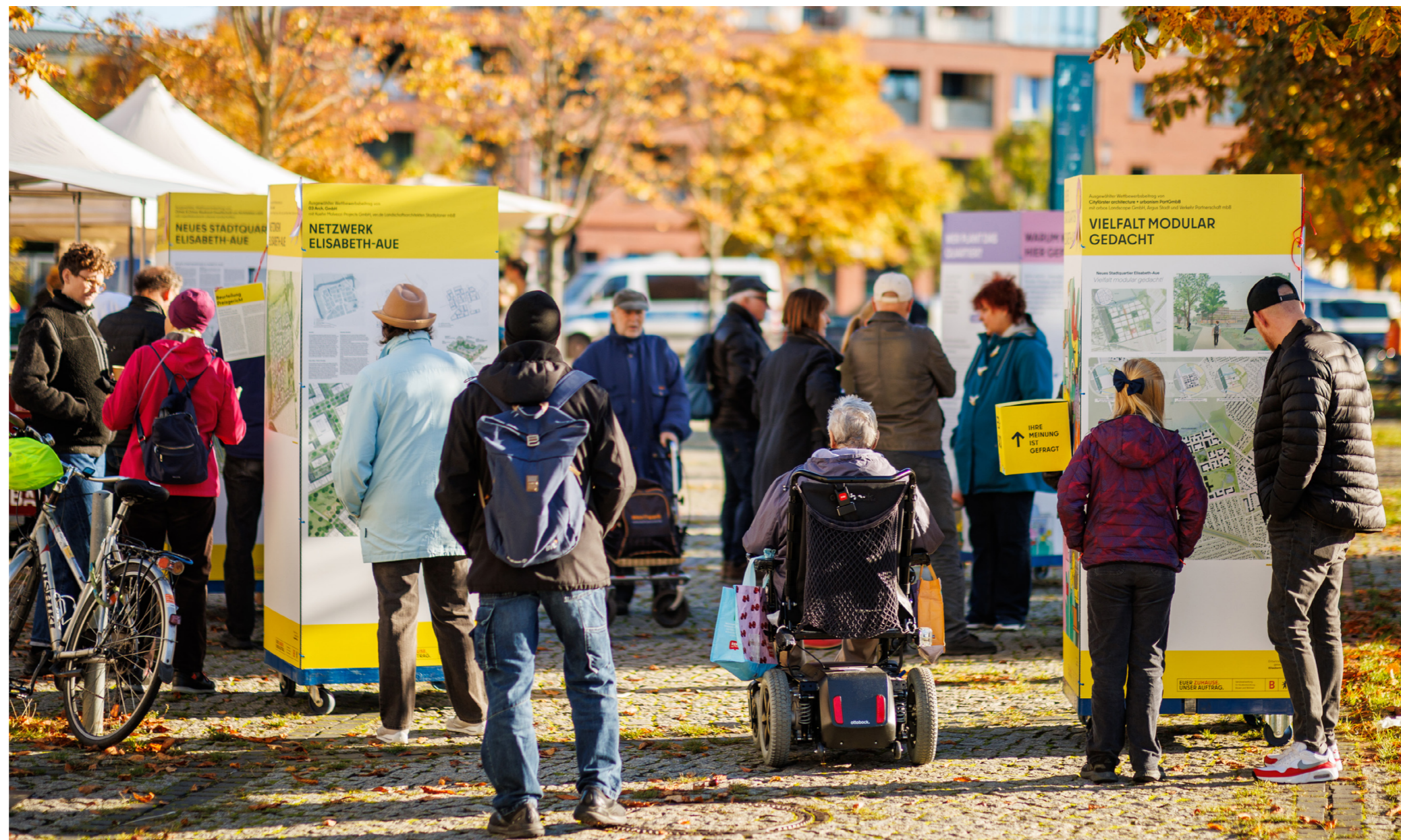
Abb. 11: Mobile Ausstellung auf dem Hugenottenplatz.

Auch bei diesen Terminen konnten Kommentare zu den Entwürfen über Feedbackboxen direkt an die Wettbewerbsteams gerichtet werden. Alle eingereichten Rückmeldungen wurden den Entwurfsteams übermittelt und flossen in das Kapitel „Beteiligungsergebnisse“ (siehe Seite 16) ein.