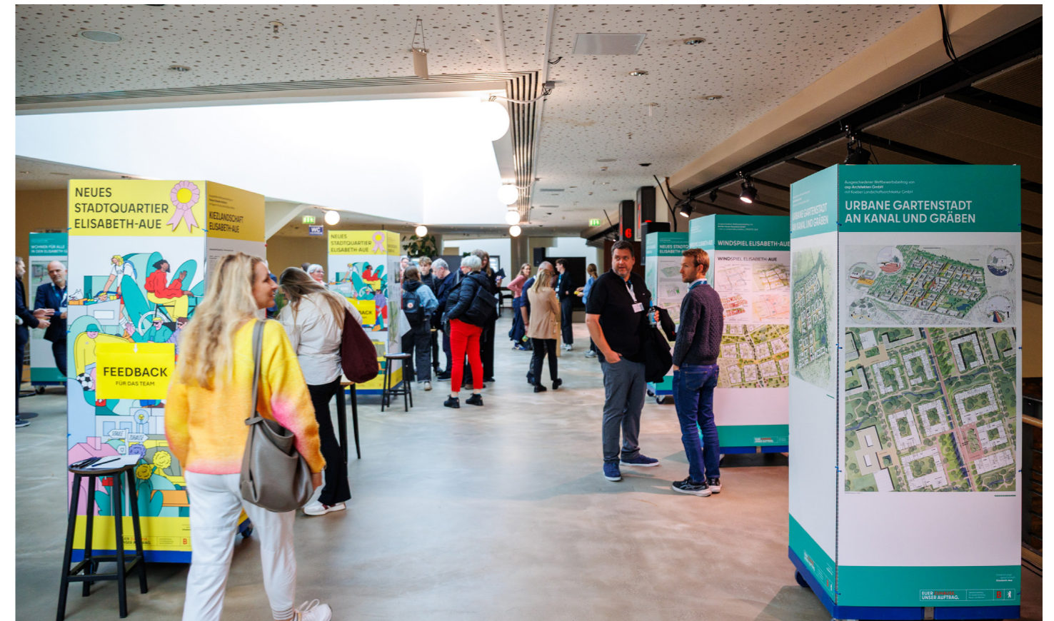
Abb. 2: Ausstellung der Entwürfe für das Werkstattverfahren und der ausgeschiedenen Entwürfe

Im Anschluss an den allgemeinen Informationsteil im Kinosaal bestand erneut die Möglichkeit, sich an den ausgestellten Tafeln tiefergehend mit den Entwürfen zu befassen und in den direkten Austausch mit den Wettbewerbsteams zu treten.