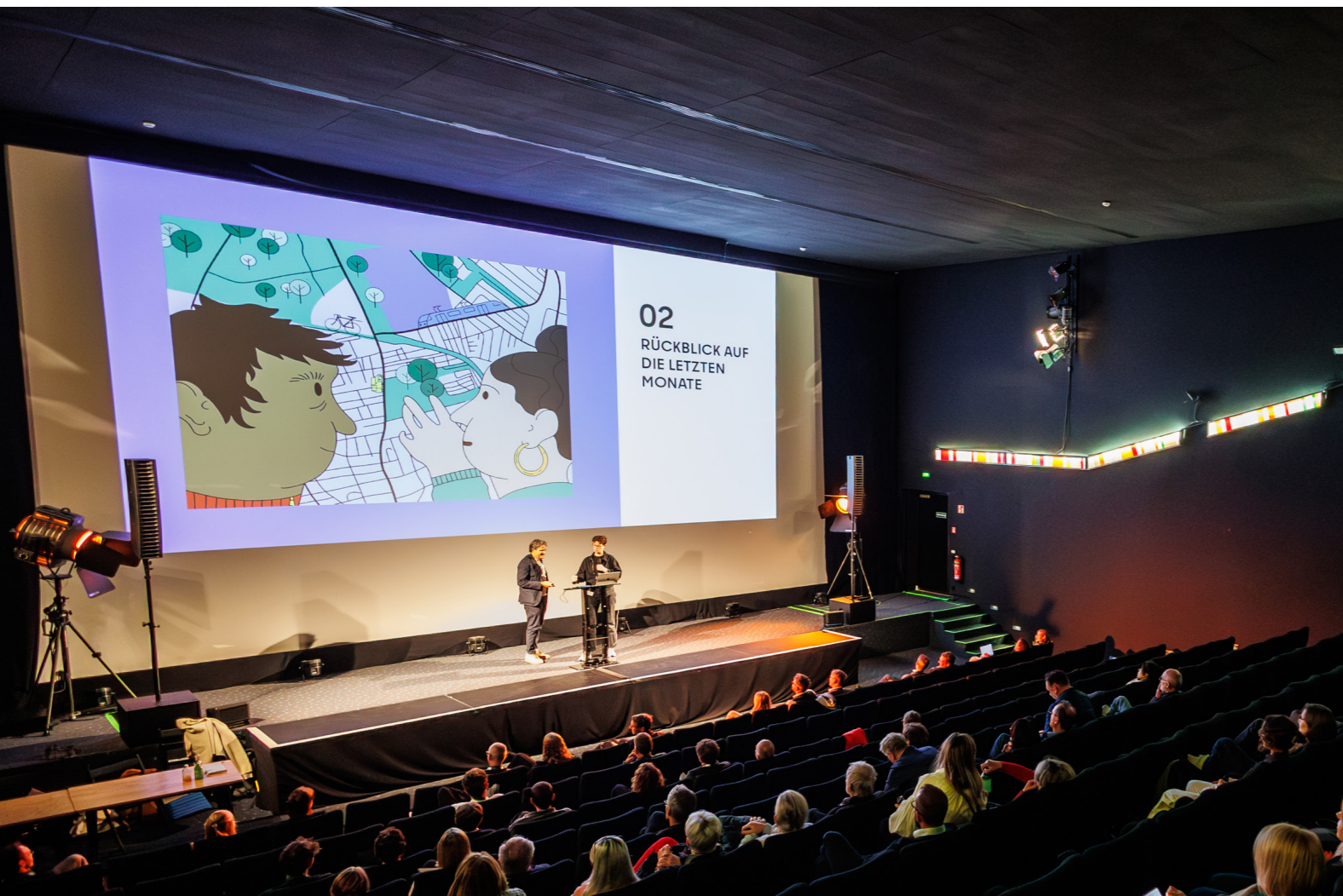
Abb. 4: Eröffnung der Veranstaltung

Aus dem Teilnahmewettbewerb seien neun Büros ausgewählt worden; vier weitere waren vorab gesetzt. Ein Büro reichte keinen Entwurf zum Ende des Wettbewerbs ein. Aus den 12 eingereichten Entwürfen wurden vier Büros für das anschließende Werkstattverfahren ausgewählt. Die Jury habe diese Auswahl mit großer Mehrheit getroffen, was die überzeugende Qualität der vier verbleibenden Entwürfe unterstreiche.