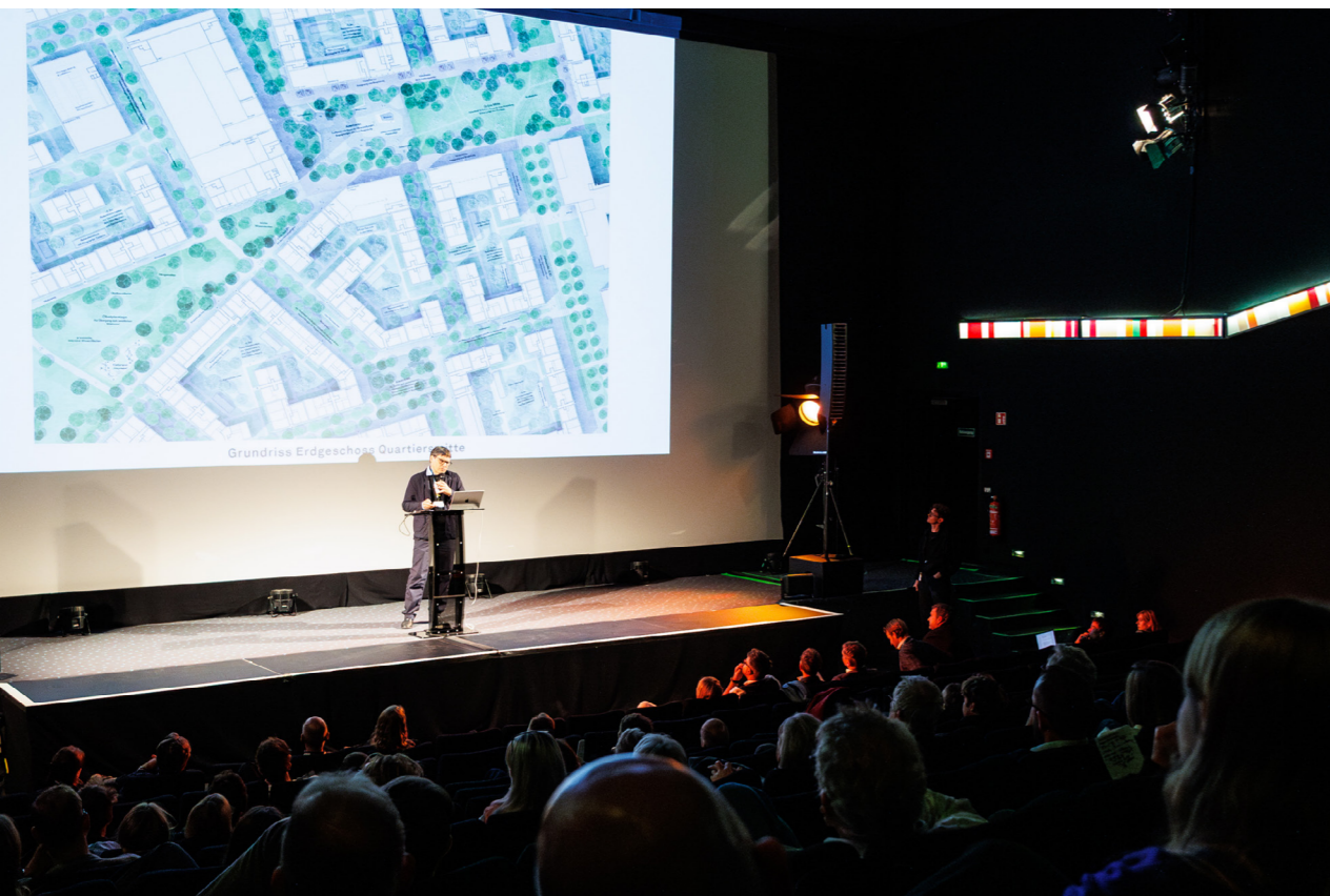
Abb. 6: 03 Arch. GmbH, Kuehn Malvezzi, ver.de Landschaftsarchitekten