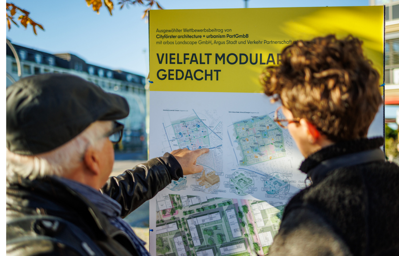
Abb. 16: Vertiefende Auseinandersetzung damit, wie das Neue Stadtquartier in Zukunft funktionieren soll

Empfohlen wurde daher, altersgerechtes Wohnen mit Optionen bis zum betreuten Wohnen zu ermöglichen und einen Anteil geförderter Eigentumswohnungen für junge Familien vorzusehen. Auf diese Weise könne einem ausgewogenen sozialen Gefüge und einer hochwertigen Versorgung aller Bevölkerungsgruppen Rechnung getragen werden.