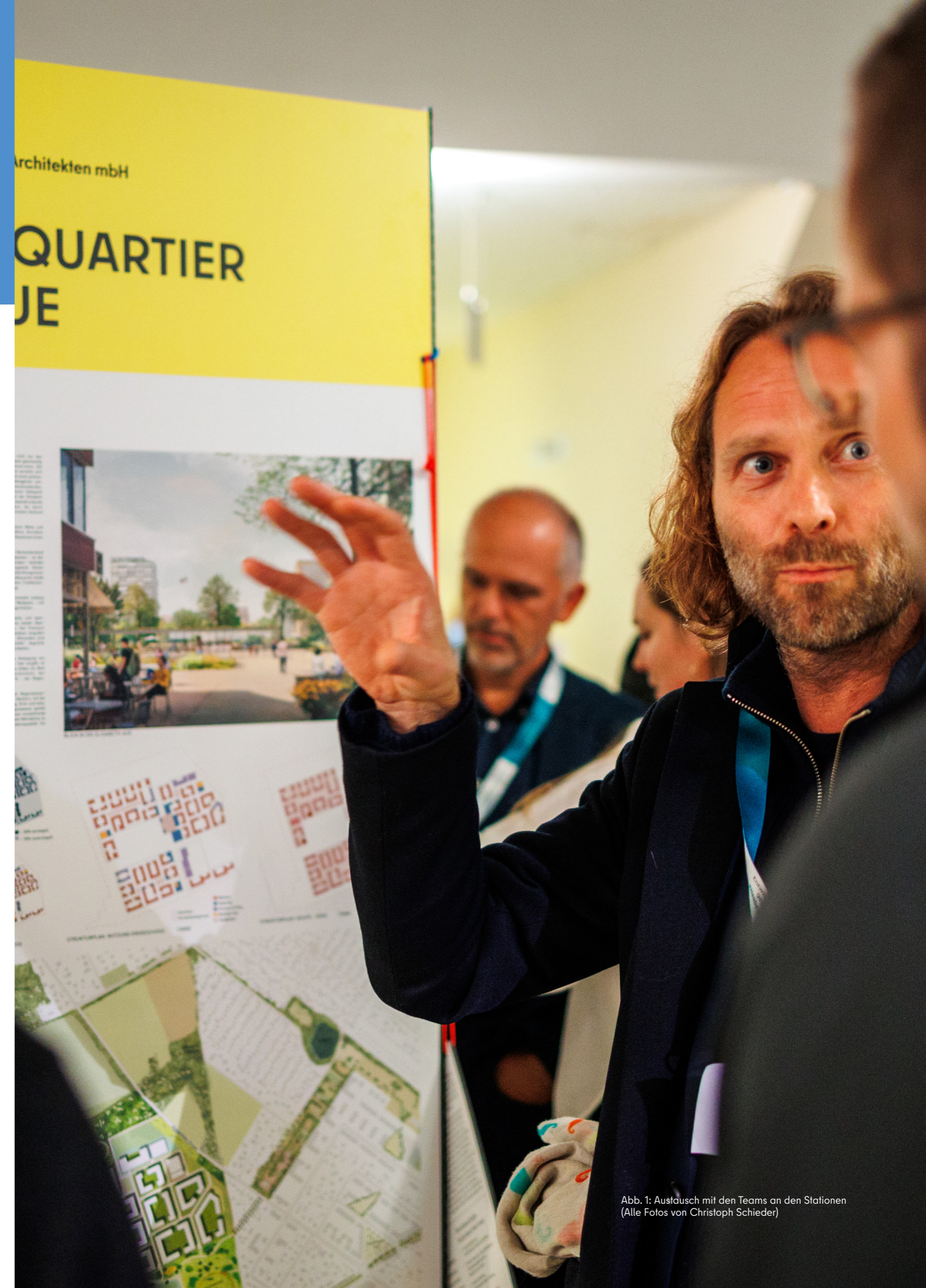
Abb. 1: Austausch mit den Teams an den Stationen