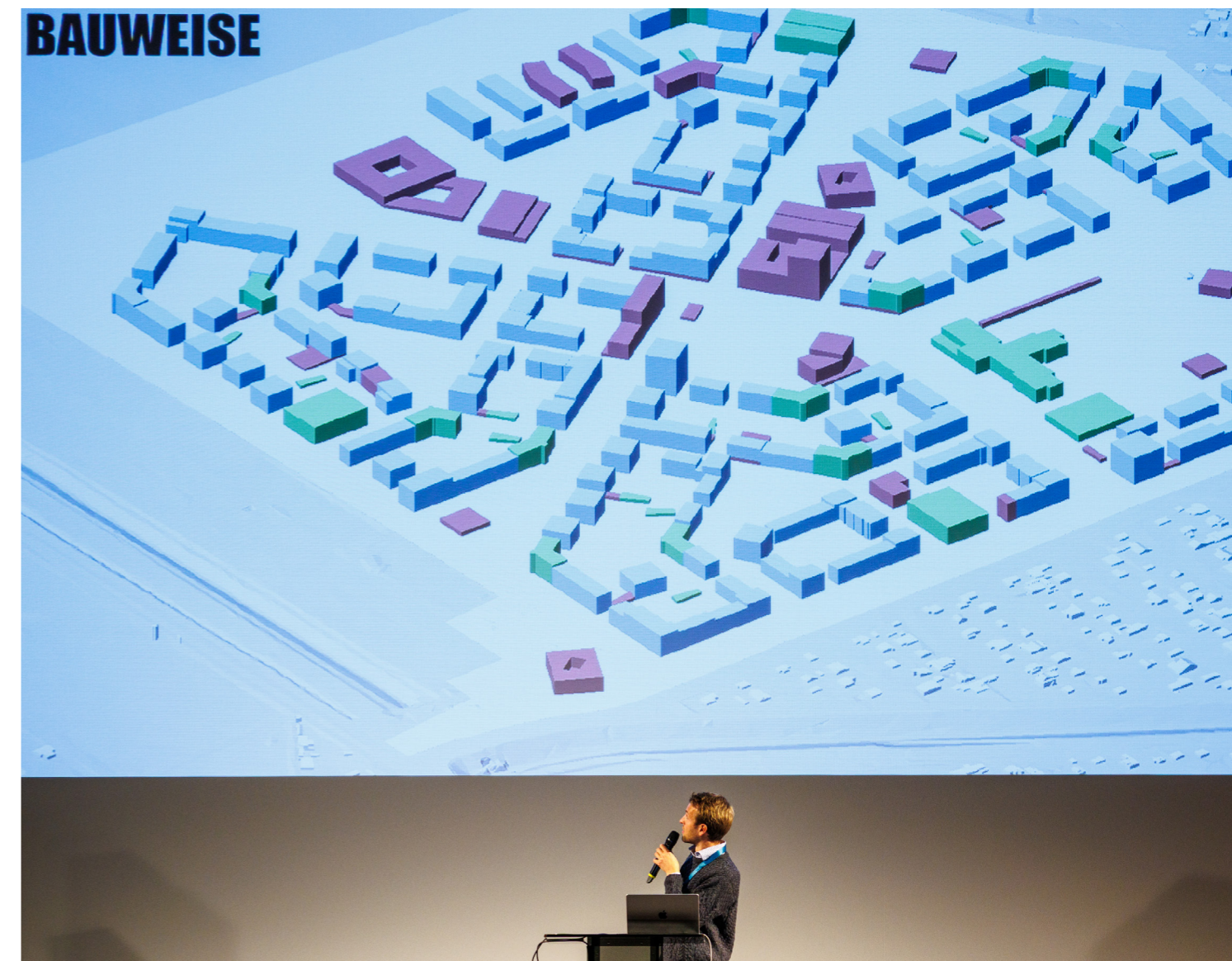
Abb. 7: Hosoya Schaefer Architects, Agence Ter .de Landschaftsarchitekten

Übergeordnete Grünbänder schaffen ein belastbares blau-grünes Netzwerk mit durchgängigen Wegen zu den umliegenden Landschaftsräumen. Insgesamt bietet der Entwurf einen starken, wiedererkennbaren Ansatz für ein gemischtes, grünes Stadtquartier.