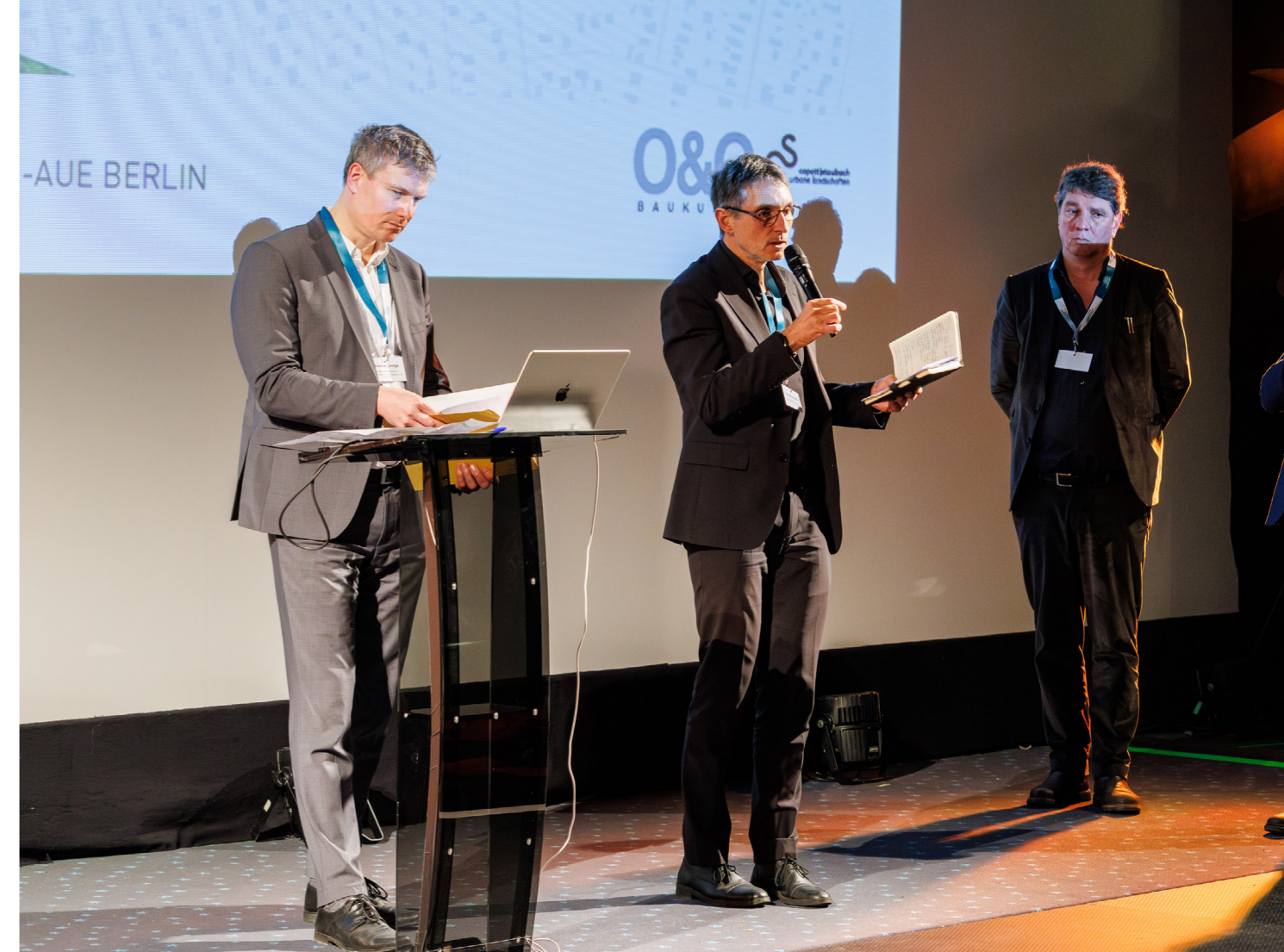
Abb. 5: Vertreter des Berliner Senats und des Bezirks Pankow (Erster und Zweiter von links) erläutern die Auswahl der vier Teams durch die Jury