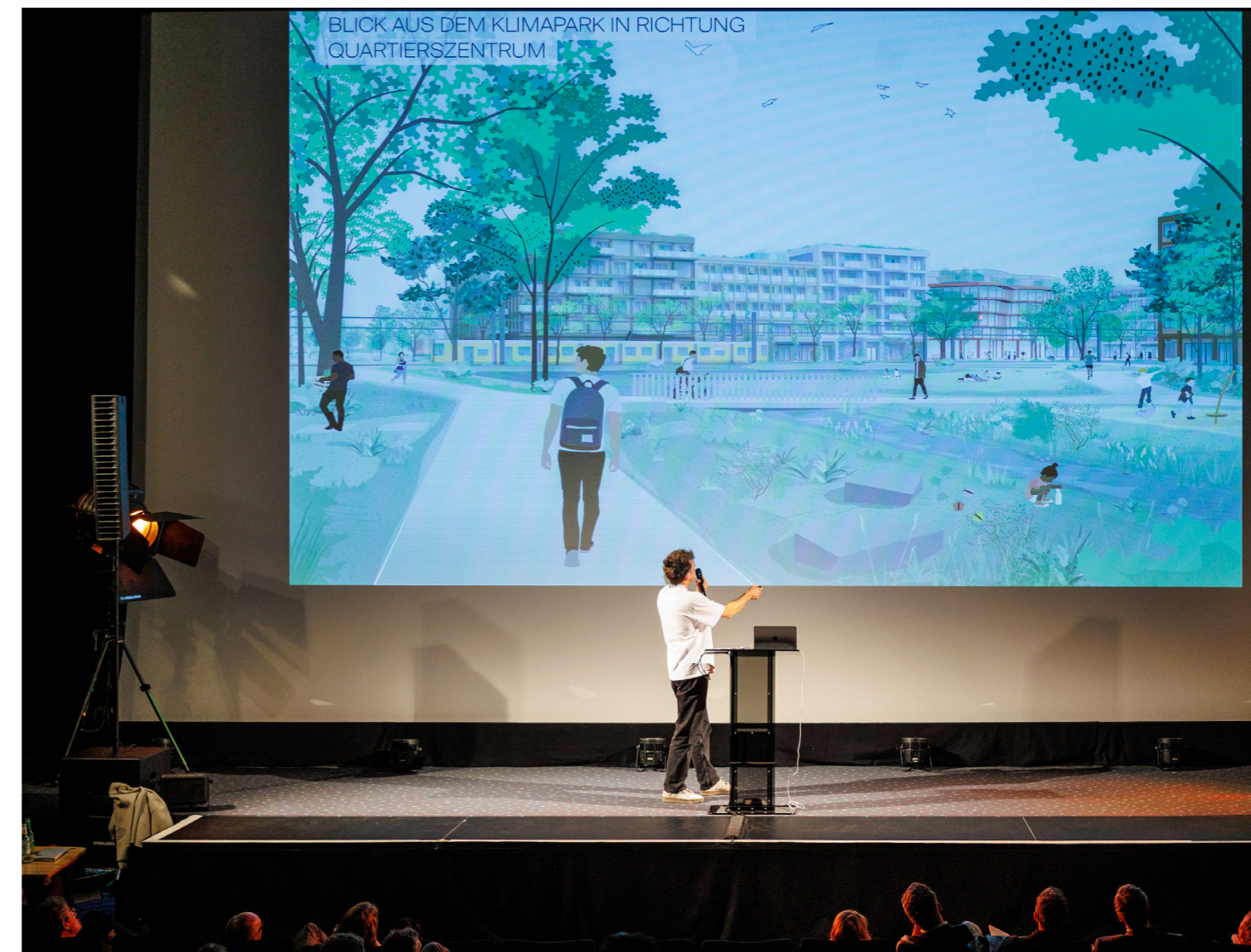
Abb. 9: Cityförster architecture + urbanism Part GmbH, arbos Landscape GmbH, Argus Stadt und Verkehr Partnerschaft mbB

Positiv bewertet die Jury die kleinteilige, differenzierte Bebauung, die trotz Wirtschaftlichkeit Vielfalt ermöglichen kann. Allerdings müssen Regeln für Abwechslung und Wohnbautypen weiter ausgearbeitet werden. Die stark wassergeprägten Freiräume gelten als unrealistisch, dennoch bietet der Entwurf gute Ansätze zur Regenwasserbewältigung. Insgesamt entsteht eine solide Grundlage für ein neues Quartier, dem jedoch noch Prägnanz und Wiedererkennbarkeit fehlen.