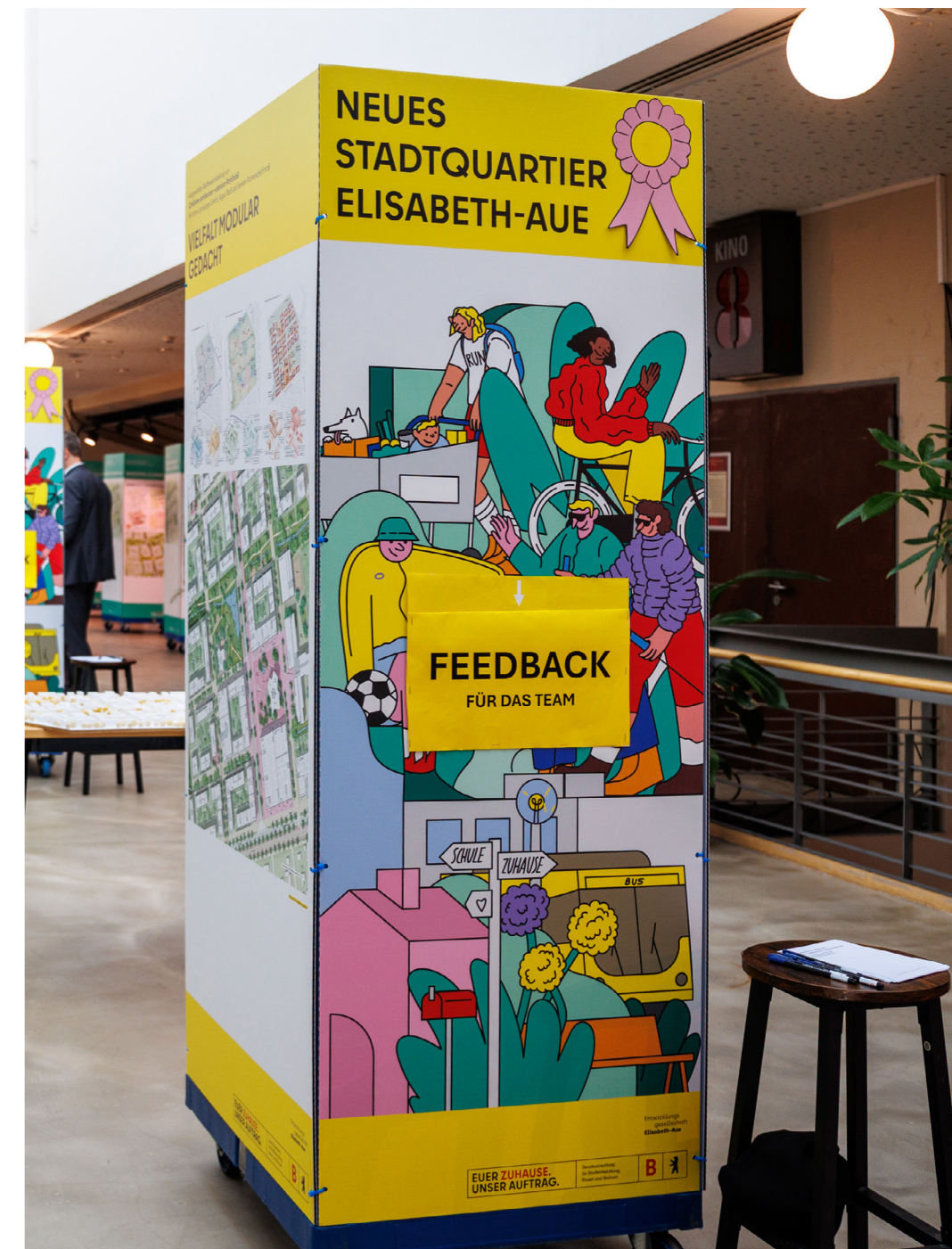
Abb. 10: Ausstellungswagen mit der Möglichkeit, Feedback direkt an den jeweiligen Entwurf abzugeben.

Während der gesamten Veranstaltung bestand die Möglichkeit, an den Stationen der Teams Fragen und Anmerkungen zu den jeweiligen Entwürfen auf Zettel zu schreiben und in die bereitgestellten Feedbackboxen einzuwerfen. Die auf diesem Weg eingegangenen Rückmeldungen sind in die Aufgabenstellung des Werkstattverfahrens eingeflossen und können im Kapitel „Beteiligungsergebnisse“ (siehe Seite 16) nachgelesen werden.