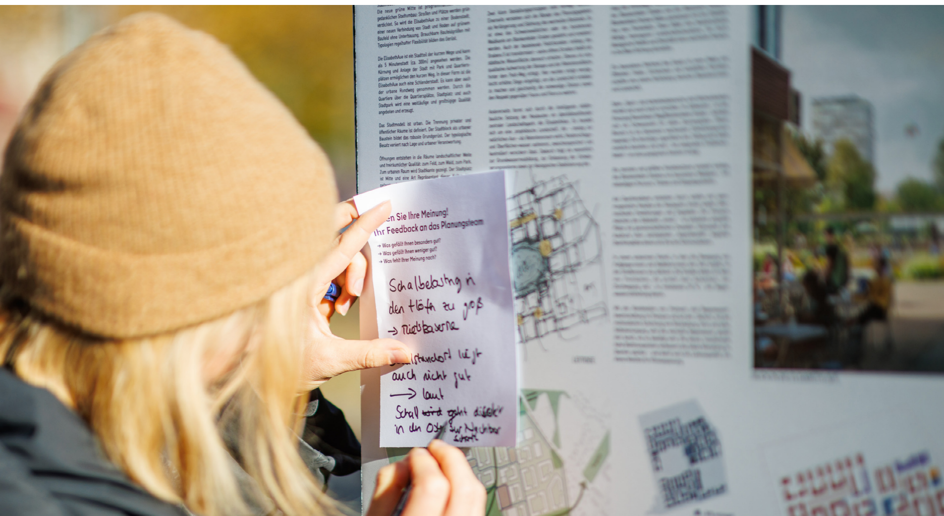
Abb. 15: Feedback an die Entwurfsteams