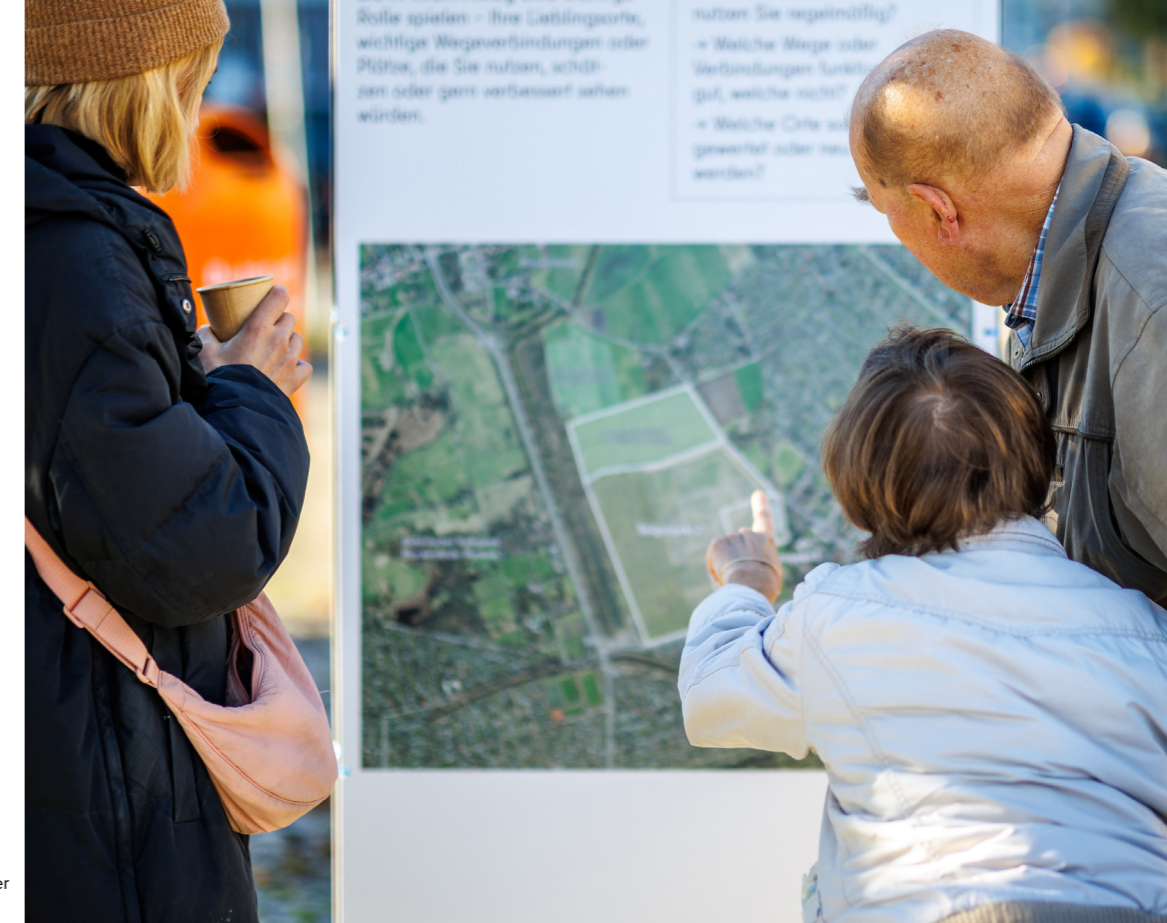
Abb. 12: Austausch über das Neue Stadtquartier Elisabeth-Aue mit Bürger:innen vor Ort.