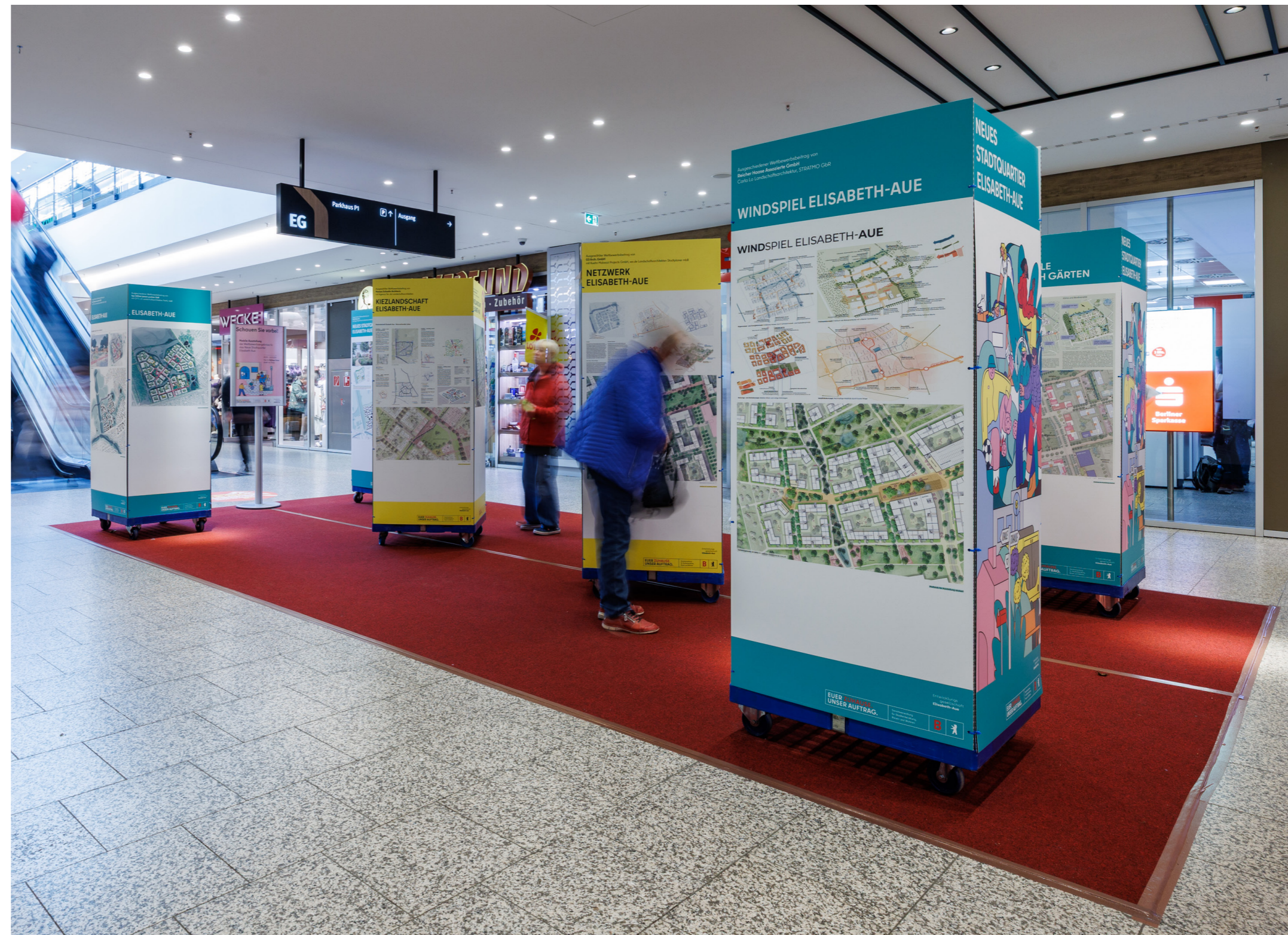
Abb. 17: Die mobile Ausstellung im Rathaus-Center Pankow.

Im bevorstehenden Werkstattverfahren gibt es jedoch erneut Gelegenheit, im Rahmen einer öffentlichen Werkstatt mit den Entwurfsteams ins Gespräch zu kommen und wichtige Hinweise einzubringen.