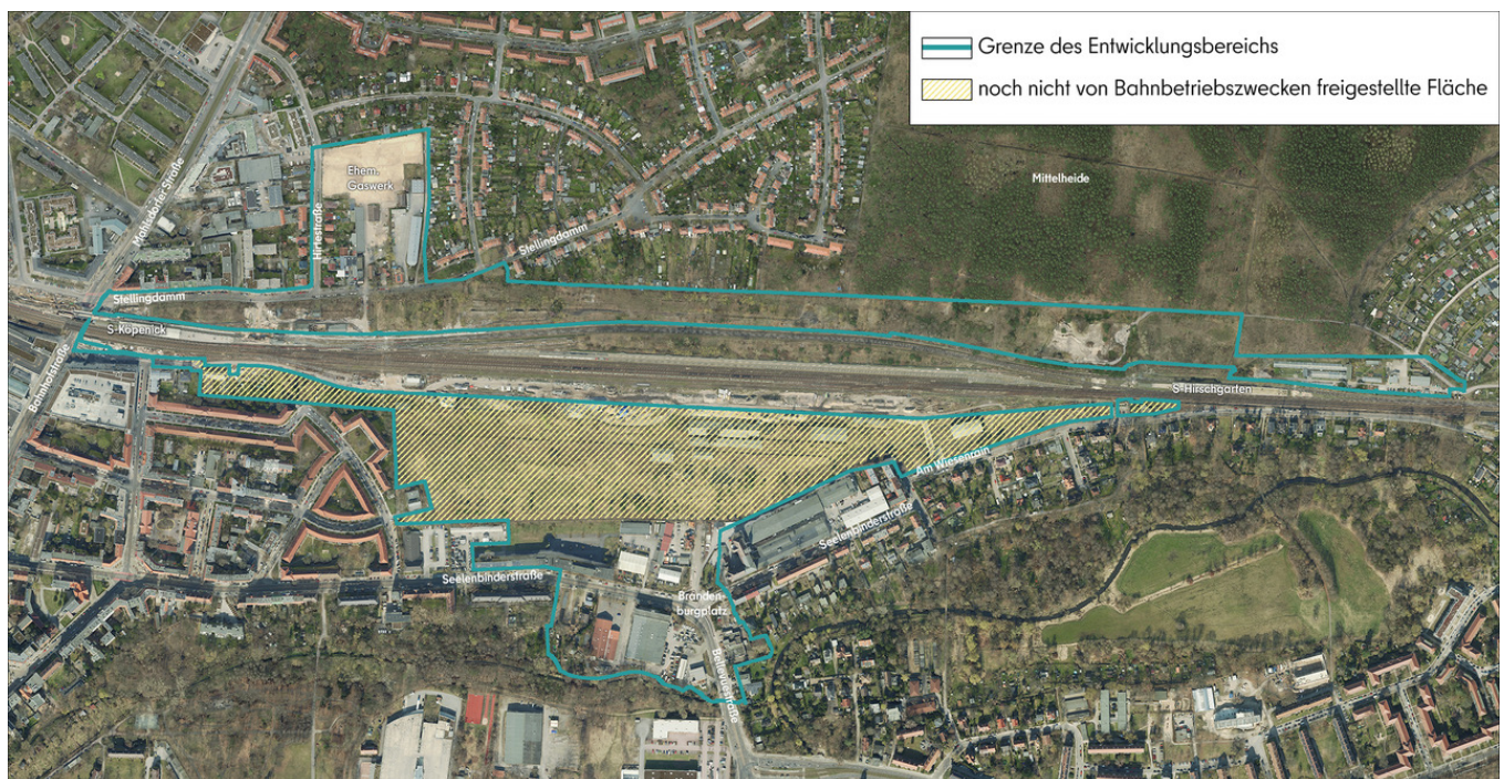
© Luftbild: Geoportal Berlin, Gebietsmarkierung: UrbanPlan 2025

Auf den betroffenen Flächen sind gemäß dem Rahmenplan als übergeordnete Planungsgrundlage des neuen Stadtquartiers mit ca. 750 Wohneinheiten ein großer Anteil des Wohnungsbaus, ein Gemeinschaftsschulstandort, eine Kita, eine Jugendfreizeiteinrichtung, Gewerbeflächen, eine Quartiersgarage sowie öffentliche Grün- und Freiräume, u.a. der Deichpark als übergeordnete Grün- und Wegeverbindung, geplant.