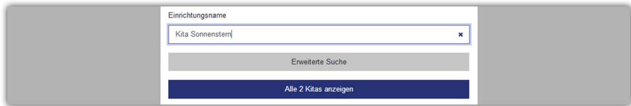
Abbildung 14: Schaltfläche für die Ergebnisanzeige

Im dunkelblauen Feld unten auf der Suche-Seite sehen Sie, wie viele Kitas der Kita-Navigator gefunden hat. Sie können auf dieses Feld klicken. Dann sehen Sie die Kitas, die der Kita-Navigator gefunden hat.