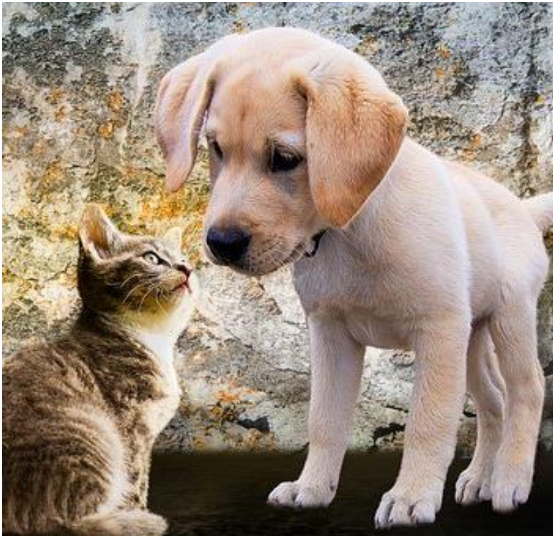
Abb. 6