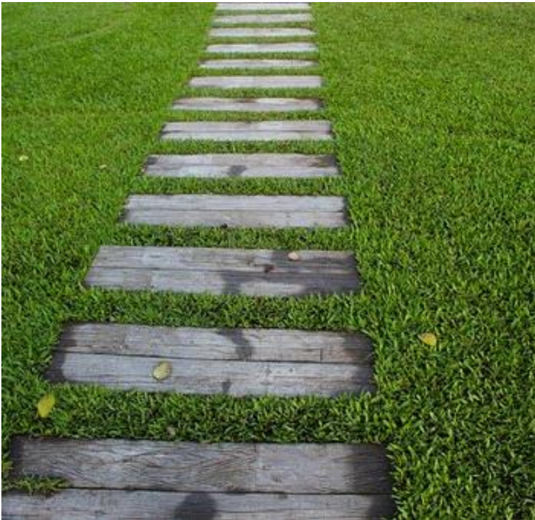
Abb. 8