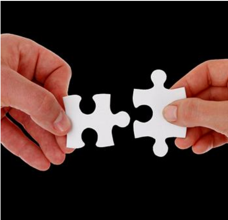
Abb. 3 Pixabay