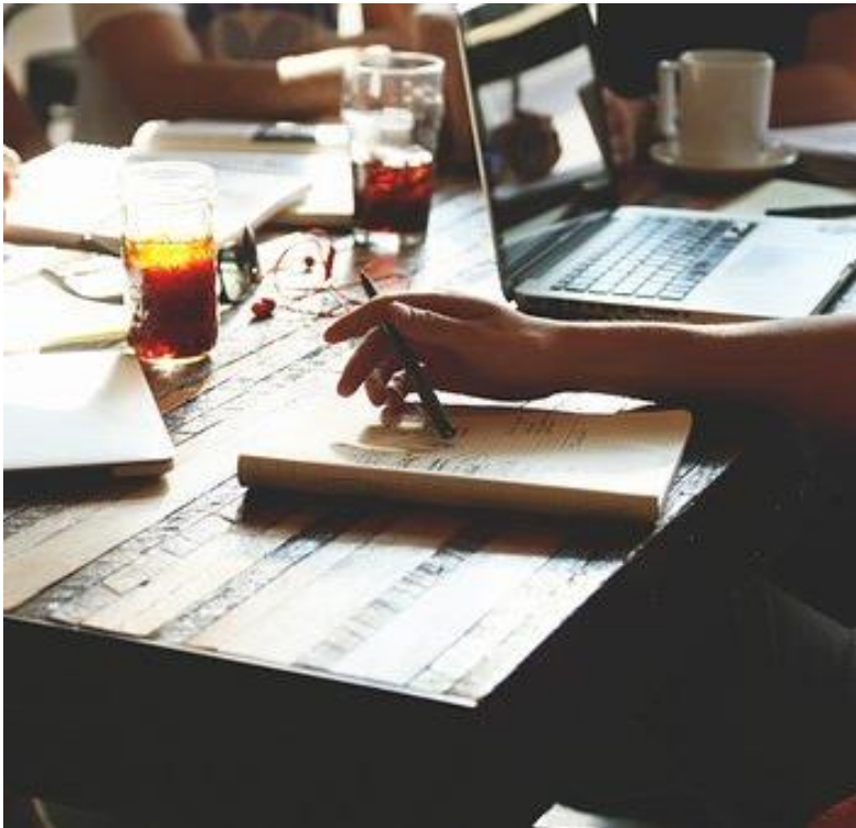
Abb. 1