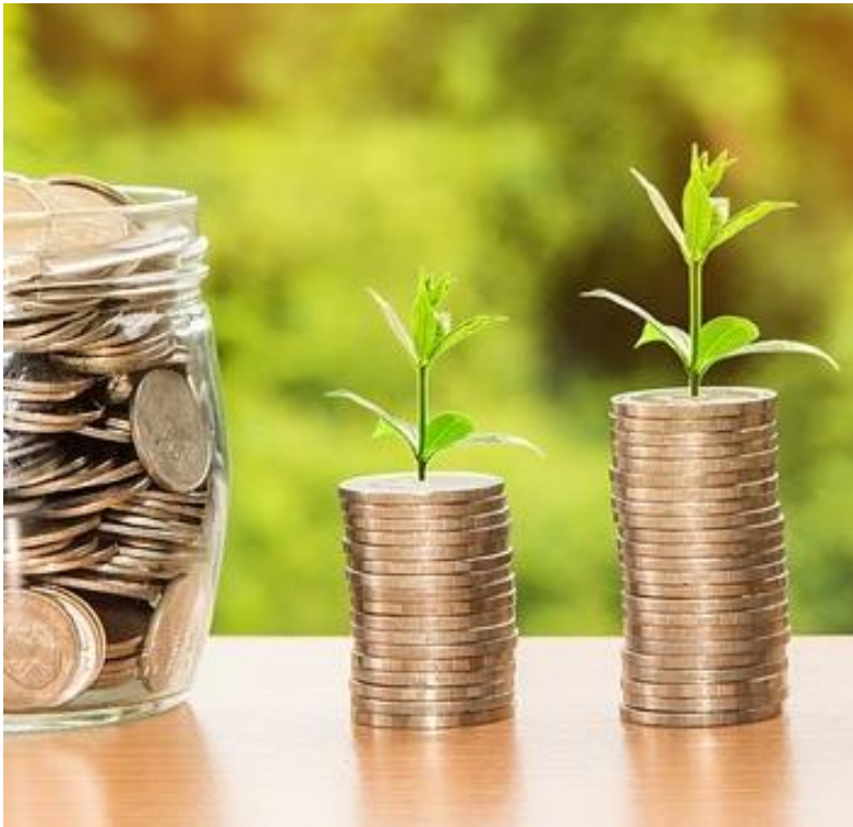
Abb. 5