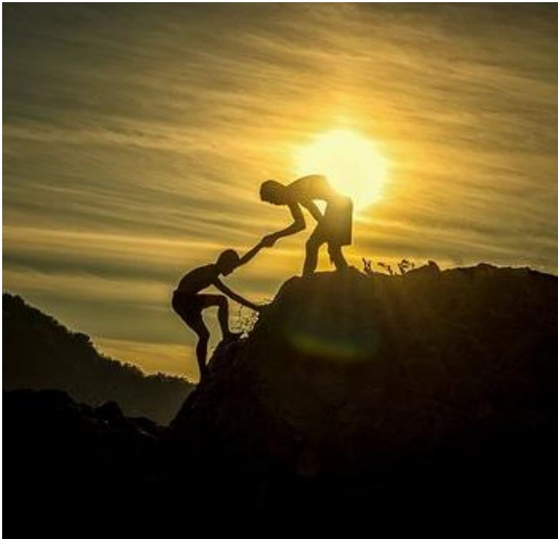
Abb. 9