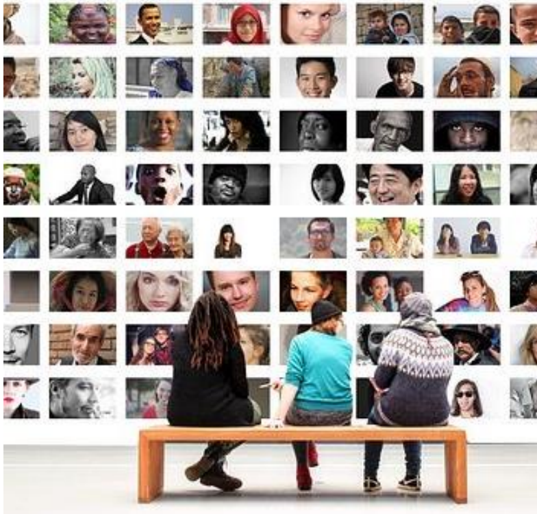
Abb. 4