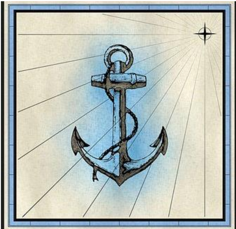
Abb. 2