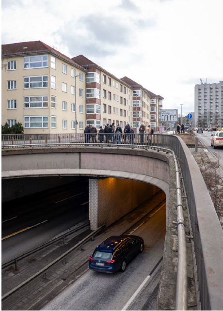
Halenseestraße Blick Richtung Süd-Westen