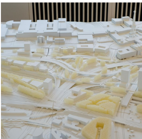
Modell: Planung Stadteingang West, Hosoya Schaefer Architects

Laut Landesdenkmalamt ist das Vorhaben auf Grundlage der vorliegenden Unterlagen nicht beurteilungsfähig. Es fehlen aussagekräftige Visualisierungen aus abgestimmten Standorten aus der Fußgängerperspektive. Die Höhe des Vorhabens wird sich weithin auf den Stadtraum auswirken und eine Vielzahl an Denkmälern betreffen. Dies bezieht sich nicht nur auf die räumliche Wirkung des nahegelegenen Funkturms (die höchsten Varianten wären 1,5-mal so hoch wie der Turm), sondern auch auf Wechselwirkungen mit weiter entfernt liegenden Denkmälern wie z. B. Park und Schloss Charlottenburg.