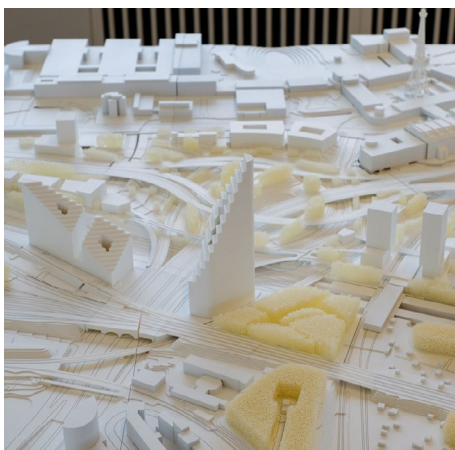
Modellvariante: Max Dudler GmbH