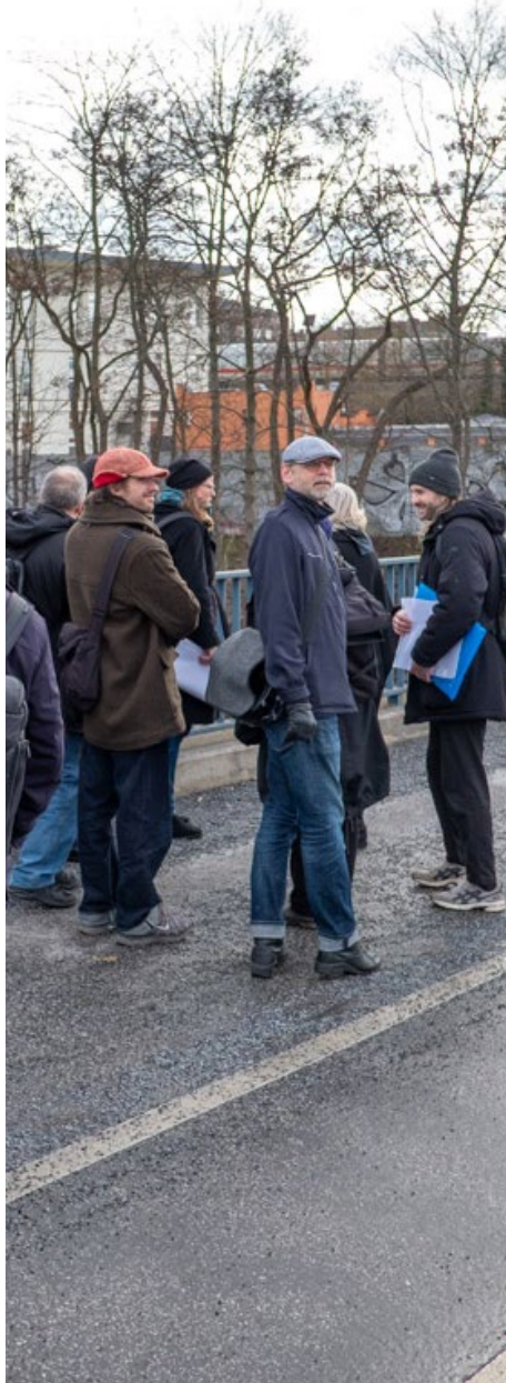
Blick auf Baufeld zum Hochhausvorhaben Halenseestraße 32