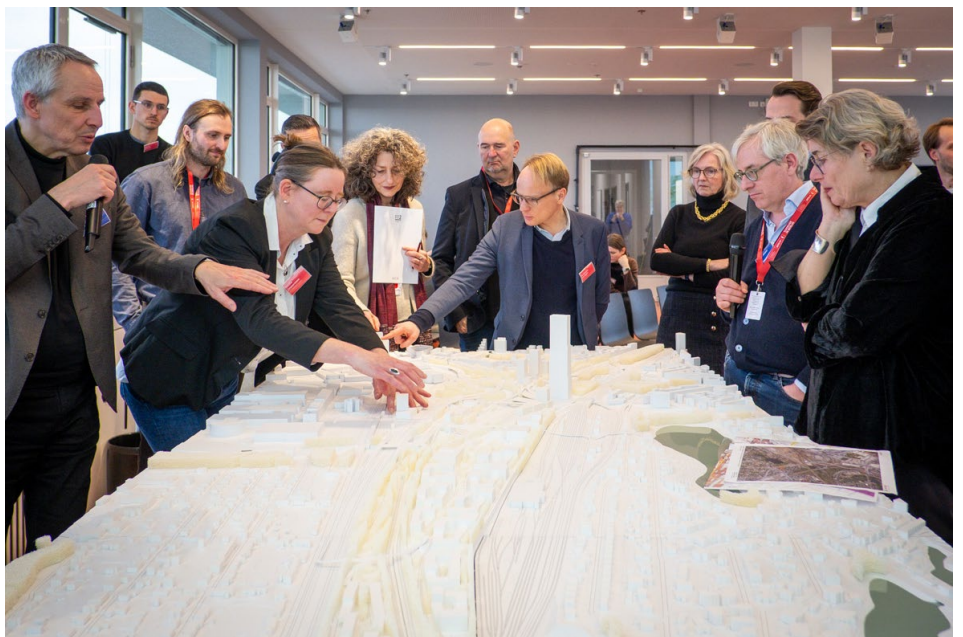
Diskussion in der internen Beratung am Modell „Stadteingang West“ zum Projekt Hochhausvorhaben Halenseestraße 32