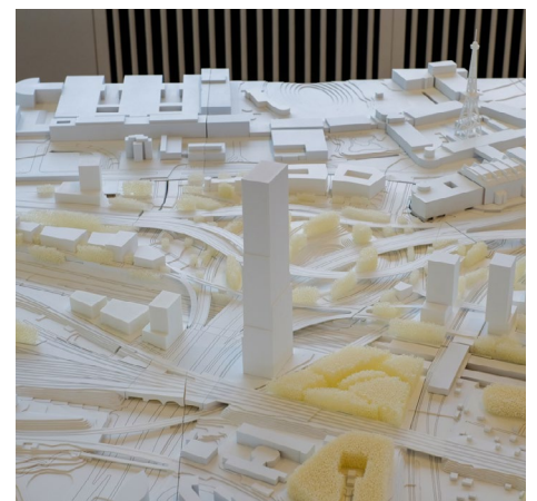
Modellvariante: Max Dudler GmbH