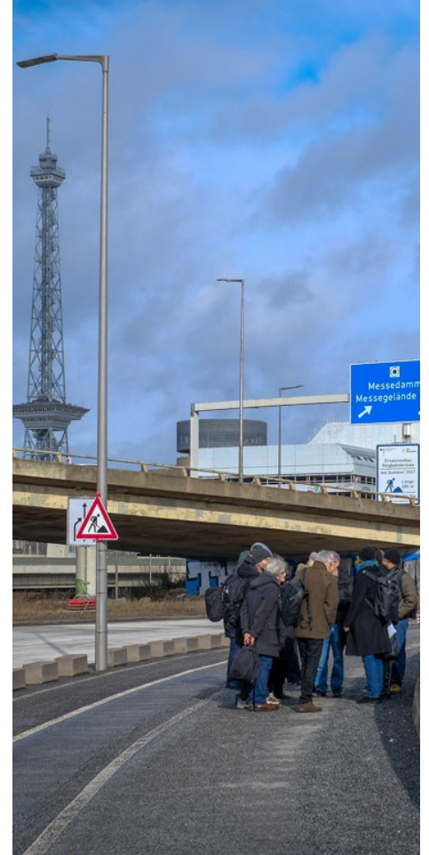
Blick auf den Funkturm und das ICC