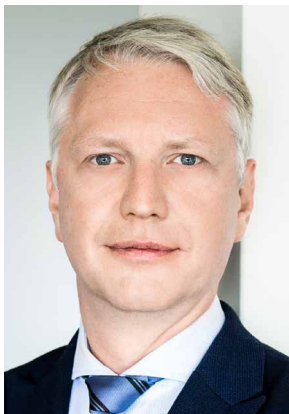
Sebastian Scheel Senator für Stadt- entwicklung und Wohnen

Im Rahmen der Berliner Schulbauoffensive steht neben dem Kapazitätsausbau (An- und Ausbau sowie Neubau) der Kapazitätserhalt (Sanierung und Abbau des Sanierungsstaus) im Vordergrund, wofür in erster Linie die Bezirke und die BIM zuständig sind. Aber auch die Senatsverwaltung für Stadtentwicklung und Wohnen und die HOWOGE übernehmen im Rahmen der Amtshilfeersuchen der Bezirke große und mittlere Sanierungsmaßnahmen. Somit wird eine Reihe unterschiedlicher Akteure für die Durchführung von Sanierungsmaßnahmen zuständig sein.