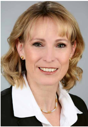
Katrin Schultze-Berndt Bezirksstadträtin für Bauen, Bildung und Kultur

Die Sanierung von Schulen wurde nach Jahren finanzieller Unterausstattung mit der Untersuchung des Sanierungsbedarfs aller Schulgebäude im Land Berlin in den Fokus des Interesses gerückt. Im Rahmen der Schulbauoffensive erfolgte eine Aufstockung der finanziellen Mittel in erheblichem Umfang. Waren bis vor ein paar Jahren nur partielle und mitunter kleinere Sanierungen in Schulen umsetzbar, können nun notwendige Grundinstandsetzungen in Angriff genommen werden.