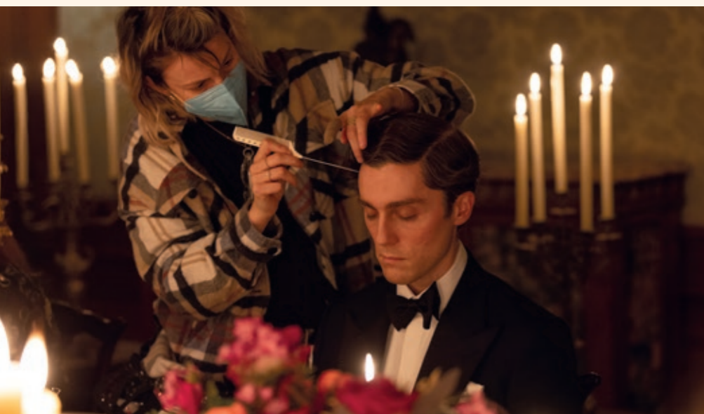
Maskenbildnerin im Einsatz am Set von Pablo Larraíns Lady-Di-Biopic „Spencer“