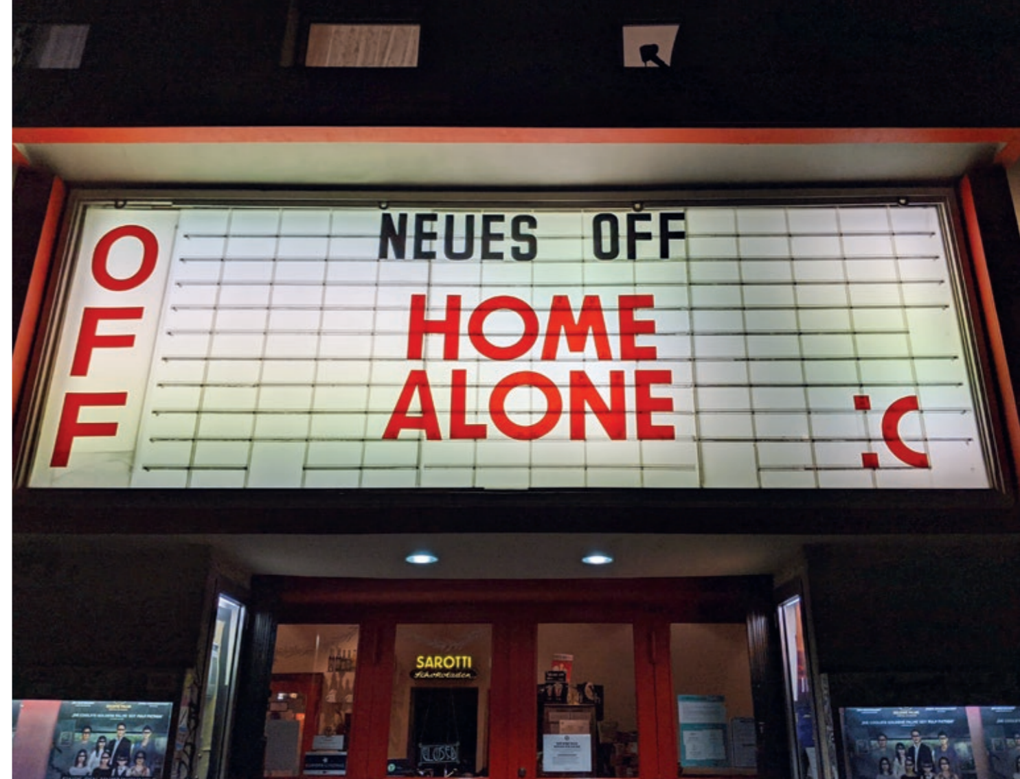
Ein Billboard, das alles sagt - während des Corona-Lockdowns waren die Kinos über Monate geschlossen und konnten keine Filme zeigen