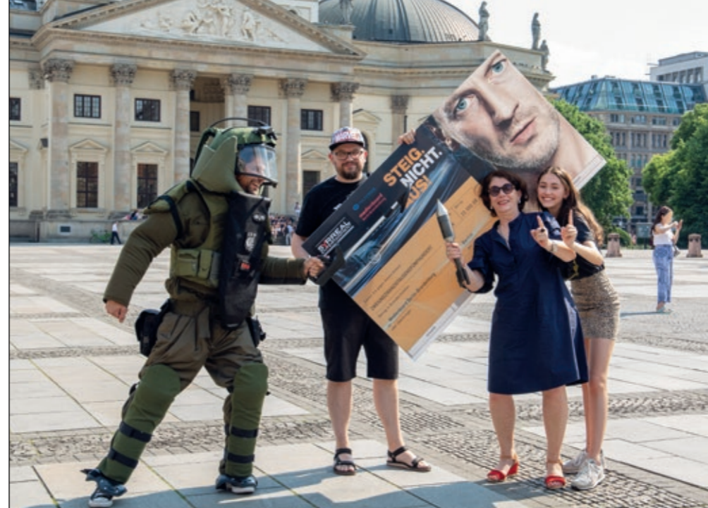
„Scheck is back“ auf dem Berliner Gendarmenmarkt: Das Team des erfolgreichen Films „Steig. Nicht. Aus!“ zahlt die Förderung ans Medienboard zurück