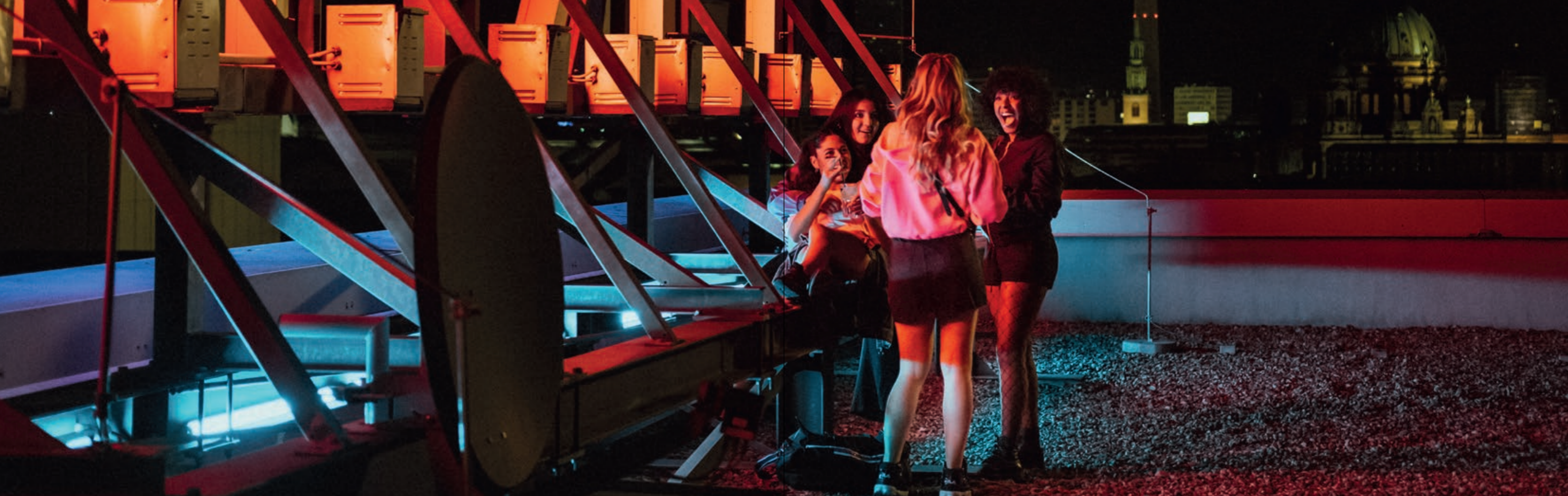
Die Dreharbeiten zur Warner TV Original Serie „Para - Wir sind King“ fanden in Berlin und Umgebung statt