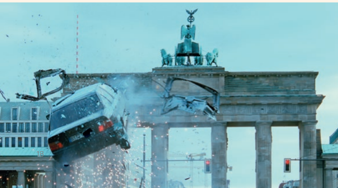
Bollywood in Berlin – der indische Megastar Shah Rukh Khan dreht für „Don 2“ eine packende Verfolgungsjagd am Brandenburger Tor