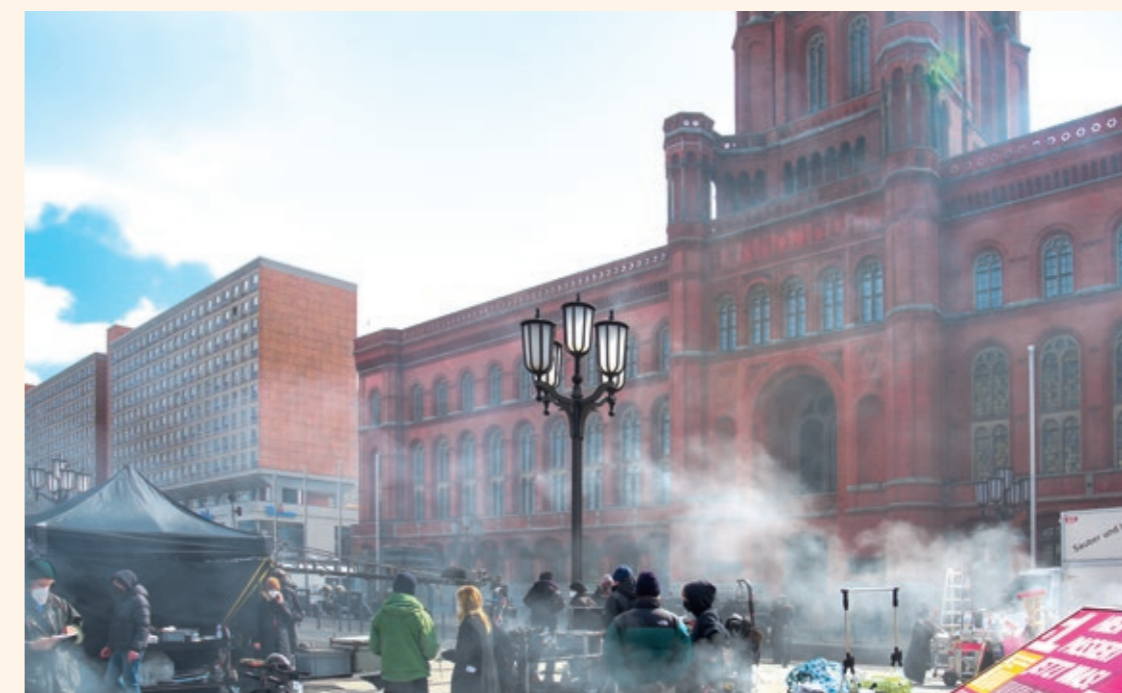
Dreharbeiten am Roten Rathaus: In der Erfolgsserie „Babylon Berlin“ wird der Sitz der Regierenden Bürgermeisterin zum Polizeipräsidium „Rote Burg“

Positiv hervorzuheben ist in diesem Zusammenhang die Charité – Universitätsmedizin Berlin. Mit der Film- und Drehkoordination wurde eine zentrale Ansprechpartnerin bei der Charité CFM Facility Management GmbH benannt, welche die Produktionen bei der Motivsuche unterstützt, sogar Drehgenehmigungen einholt und in allen Fragen zum organisatorischen Ablauf mit Rat und Tat zur Seite steht und Anfragen für den Drehort Charité zuverlässig bearbeitet. Dieses Modell sollte als Vorbild für vom Land Berlin getragene Körperschaften und Unternehmen mit attraktiven Motiven für die Film- und Fernsehindustrie, wie Wohnungsbaugesellschaften und Verkehrsdienstleister, dienen. Auch die Berliner Immobilienmanagement GmbH ist in den letzten Jahren zu einer sehr erfahrenen Motivgeberin und wichtigen Partnerin für die Produktionen geworden. Zugang zu einer breiten, vielfältigen Palette von Motiven stärkt die Qualität der Filme und vor allem den Medienstandort Berlin.