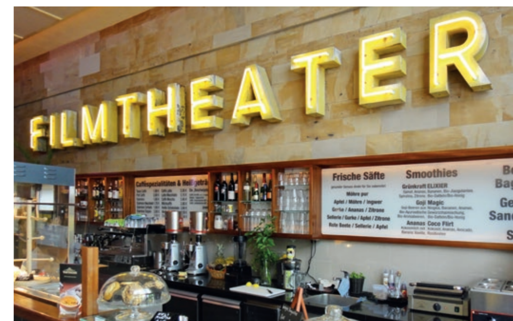
Ausgezeichnetes Filmtheater – das Kino UNION in Friedrichshagen wird wegen seines abwechslungsreichen Kinoprogramms regelmäßig mit dem Kinoprogrammpreis Berlin-Brandenburg geehrt