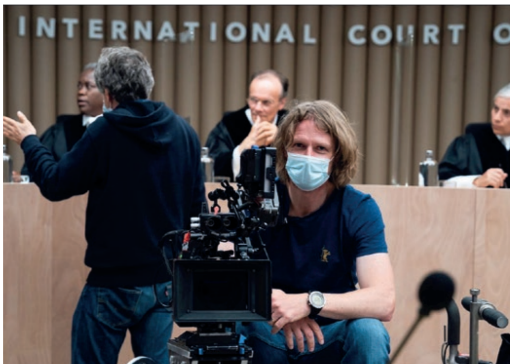
Drehen mitten im Lockdown - verschärfte Hygienemaßnahmen am Set des MBB-geförderten TV-Films „Ökozid“

mit ihrem qualitativ hochwertigen Ausbildungsangebot im Bereich Film/Fernsehen zur internationalen Strahlkraft Berlins als führendem Filmstandort sowie zur Bekämpfung des Fachkräftemangels bei. Das Land Berlin befindet sich hier in der Rolle des Zuwendungsgebers und hat den Vorsitz im Aufsichtsgremium (Kuratorium) inne. Detaillierte Ausführungen zu diesem Punkt sind unter „Fachkräftemangel begegnen“ einsehbar.