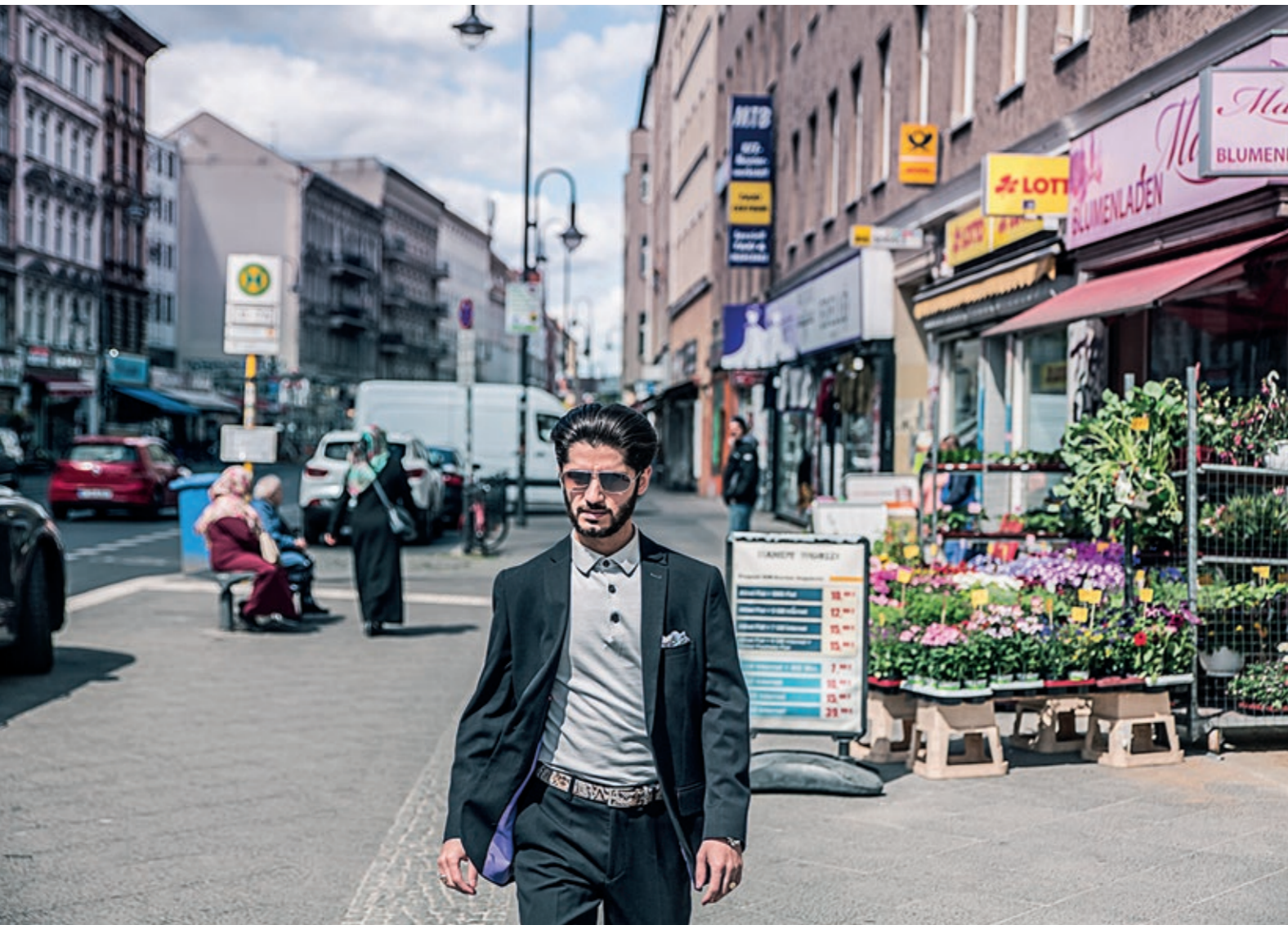
Drehaufnahmen in Berlin Neukölln für die deutsche Warner TV Serie „4 Blocks“; Regie führten Marvin Kren, Oliver Hirschbiegel und Özgür Yıldırım

nen, die den Geist der Stadt spiegeln, verstärkt. Unter den jährlich ca. 250 Produktionen sind eine ganze Reihe internationaler Großproduktionen und Serien entstanden – darunter beispielweise Filmprojekte mit Stars wie Kristen Stewart („3 Engel für Charlie“), Michael B. Jordan & Jamie Bell („Without Remorse“) und Keanu Reeves und Priyanka Chopra („Matrix 4“). Auch deutsche Serien wie „Babylon Berlin“, „Unorthodox“, „Dogs of Berlin“, „4 Blocks“ oder „Berlin Station“ werden weltweit millionenfach abgerufen. In ihnen kommt Berlin als Ort eine zentrale Bedeutung zu.