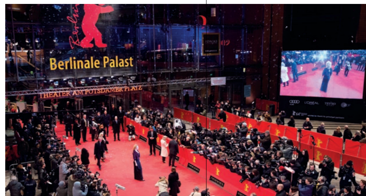
Berlinale Palast – der Rote Teppich am Premierenkino des Wettbewerbs