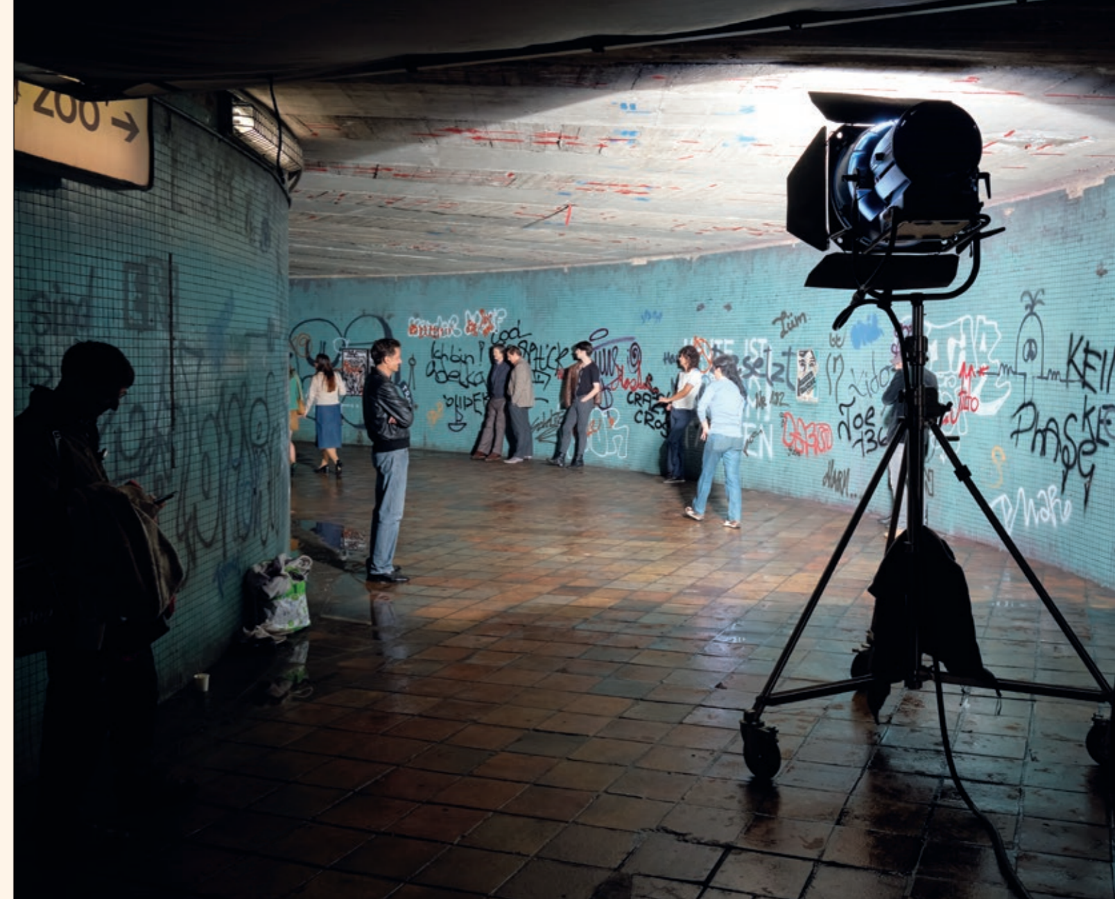
Neuerfilmung der legendären Biografie von Christiane F. – für die 8-teilige Serie „Wir Kinder vom Bahnhof Zoo“ dreht das Team an Originalschauplätzen in Berlin

Gewerbliche Dreharbeiten im öffentlichen Straßenland sind erlaubnispflichtig. Das gilt grundsätzlich auch für sogenannte „Bagateldreharbeiten“. Unter „Bagateldreharbeiten“ werden solche Dreharbeiten verstanden, die sich nur geringfügig auf den Gemeingebrauch auswirken. In den letzten Jahren – zuletzt 2021 – wurde versucht, ein