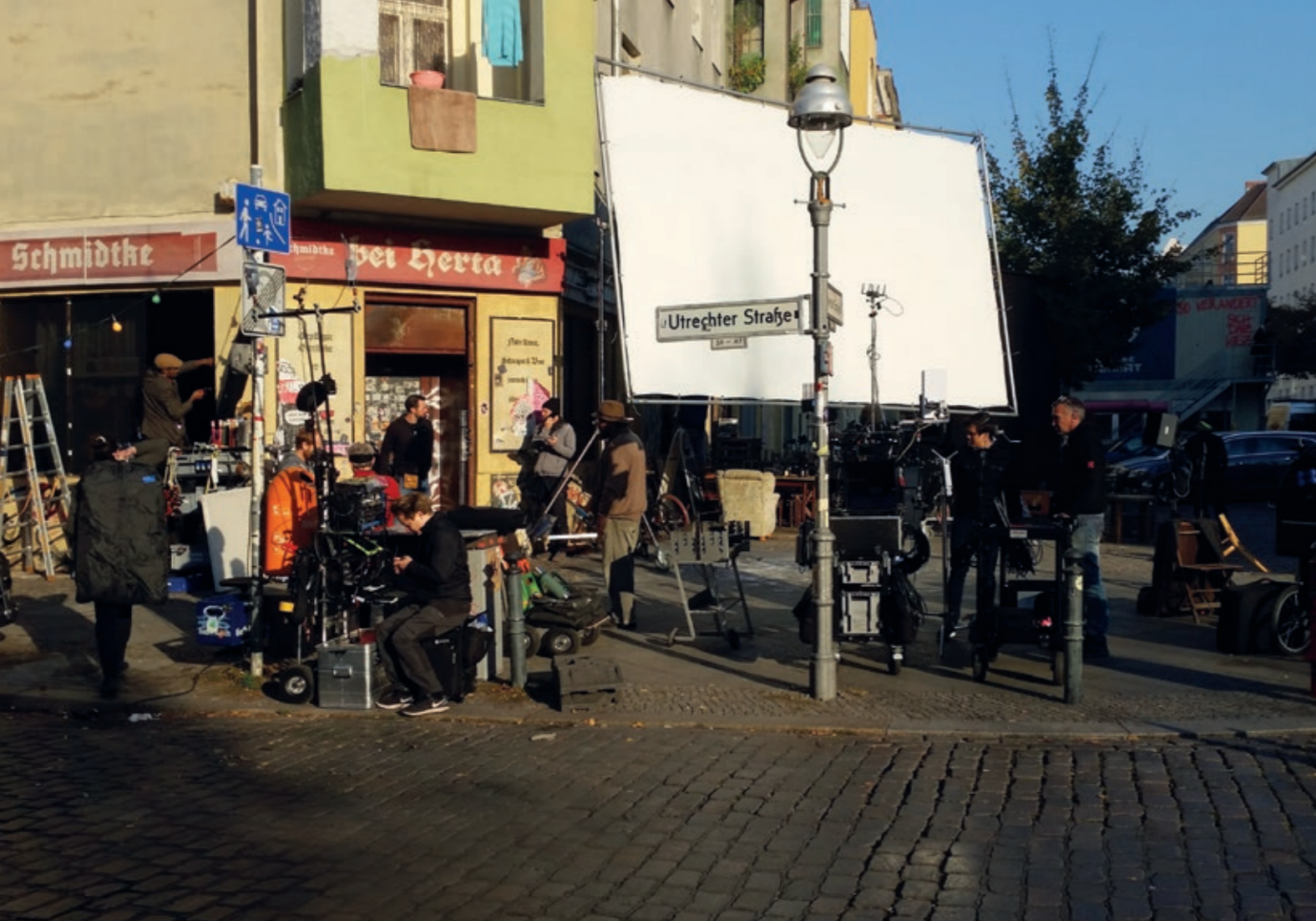
Film im Kiez – für „Die Känguru-Chroniken“ wurde im Wedding gedreht