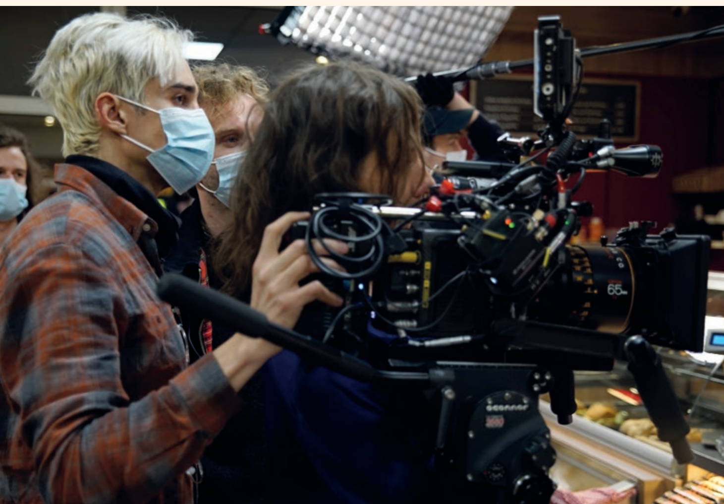
Am Set des Abschlussfilms „Tamara“ von Jonas Ludwig Walter

Für die Zukunft der Branche ist das Nachwuchsmarketing ein wesentliches Element. Dabei müssen neue Kommunikationskanäle – wie z. B. Social Media – erschlossen werden. Hier spielt auch die Verwendung der Sprache der Zielgruppe eine zentrale Rolle. Multiplikatoren sollen aktiviert und deren Reichweite genutzt werden (Streamer, Faces/Influencer, Produzentinnen und Produzenten etc.). Berufs- und Karrieremesen sind entscheidend. Darüber hinaus ist Kooperation mit und Präsenz an Ausbildungseinrichtungen, Schulen und Hochschulen wichtig. Bei der Beratung kommen Kooperationen mit der Bundesagentur für Arbeit, BIZ und ZAV in Betracht. Schließlich sollte auch die Zusammenarbeit mit Filmparks, Filmstudios, Kinos und Filmmuseen gestärkt werden.