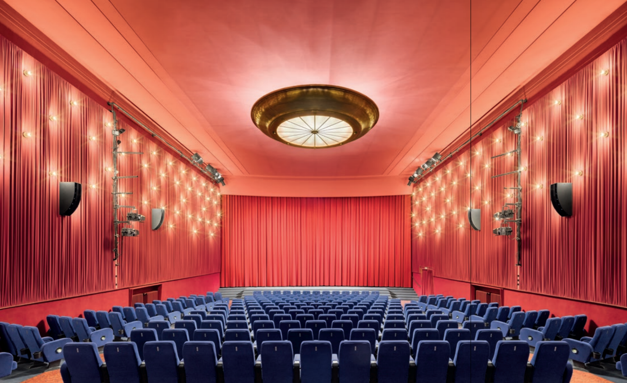
Delphi Filmpalast in Charlottenburg: der größte Programmkinosaal Deutschlands mit mehr als 670 Sitzen und Laser-Projektion

Mit seinen rund 100 Kinos, davon 55 Programmkinos, hat Berlin – selbst im weltweiten Vergleich – eine einzigartige Kinolandschaft. Neben den vielen kleineren Filmfestivals trägt die Berlinale als größtes Publikumsfilmfestival der Welt ganz besonders zu Berlins Filmkultur bei. Mit ca. 500.000 Besuchenden jährlich ist die Berlinale ein Publikums- und Medienmagnet und bietet allen Filminteressierten sowie der gesamten Filmbranche die Möglichkeit, in den Austausch zu gehen. Auch die kleineren Festivals wie „achtung berlin“, „new berlin film award“ oder das „Jüdische Filmfestival“ stellen eine einzigartige Filmkultur in Berlin dar und sind imageprägend für die Stadt.