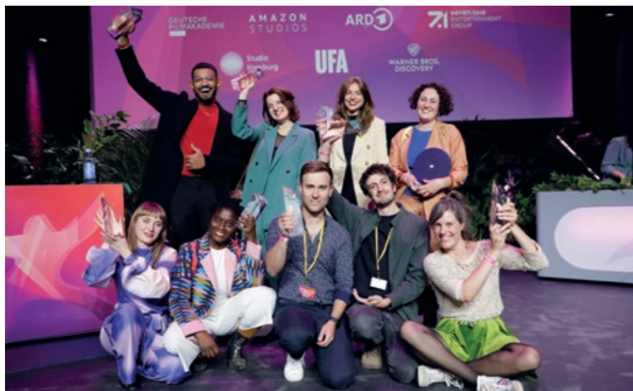
Erste Schritte in eine erfolgreiche Filmkarriere - beim wichtigsten deutschsprachigen Nachwuchs-Filmpreis, den First Steps Awards, trifft sich alljährlich geballtes Talent in der Filmhauptstadt