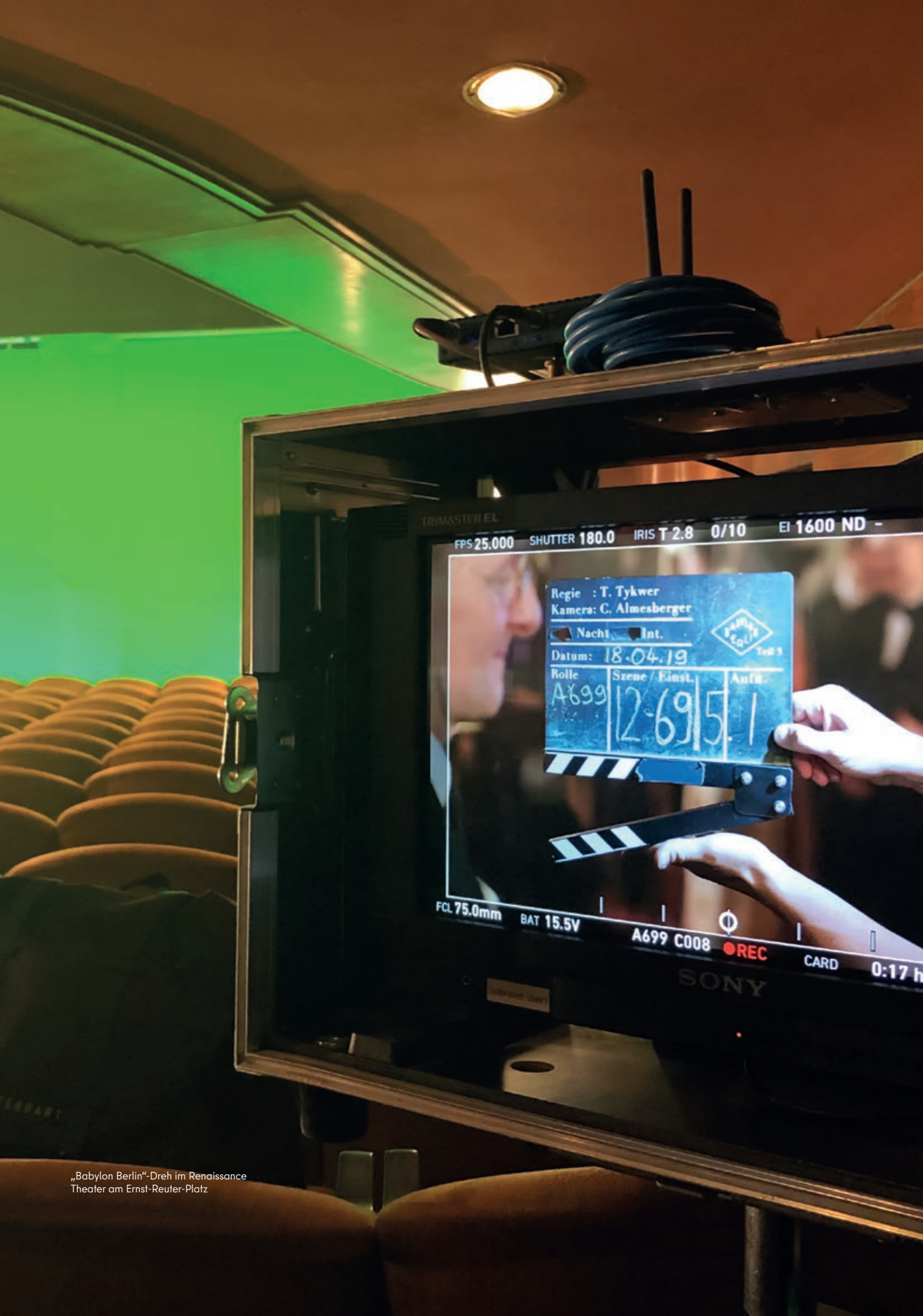
„Babylon Berlin“-Dreh im Renaissance Theater am Ernst-Reuter-Platz