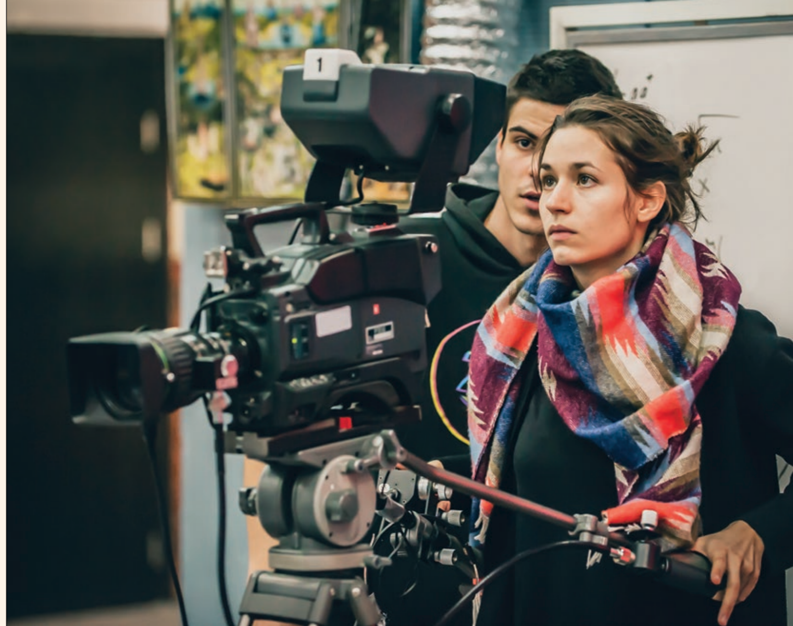
Das Land Berlin verfügt über zahlreiche akademische sowie nicht akademische Ausbildungs- und Weiterbildungsangebote