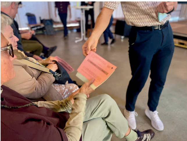
Die Wahl in vollem Gange (links und rechts)