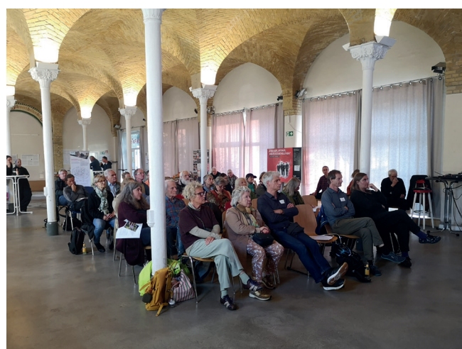
Die Teilnehmenden des Forums (links) Die ehem. Delegierten werden verabschiedet (rechts)