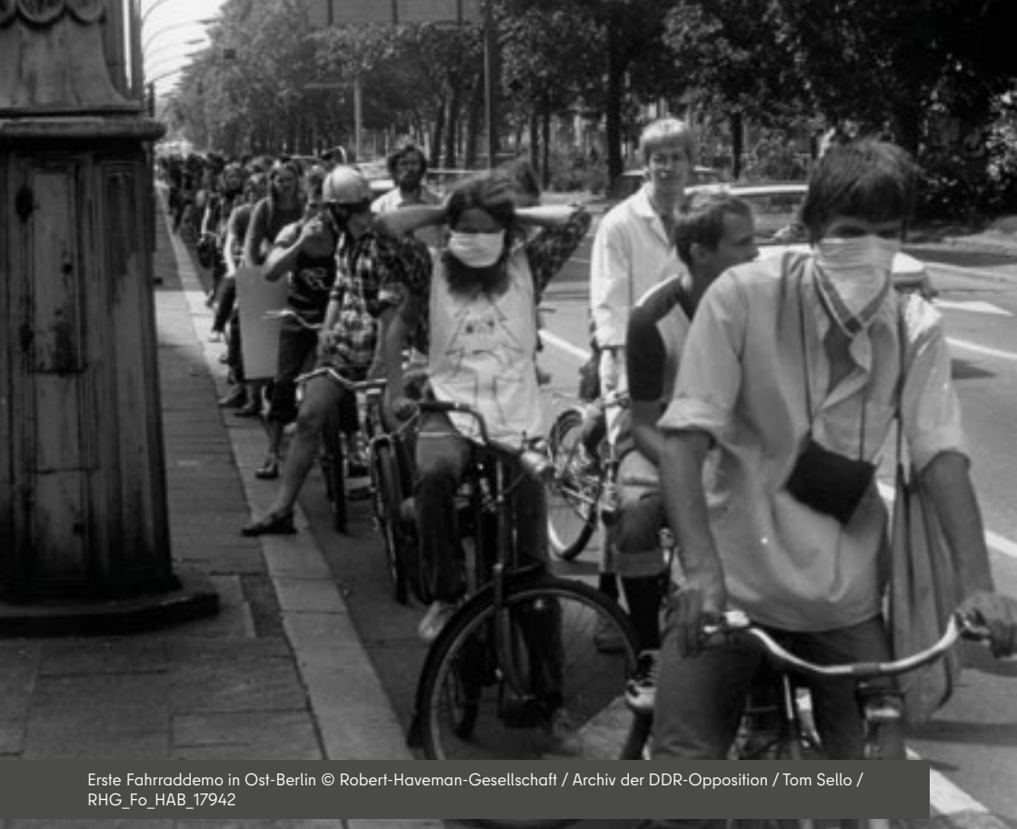
Erste Fahrraddemo in Ost-Berlin