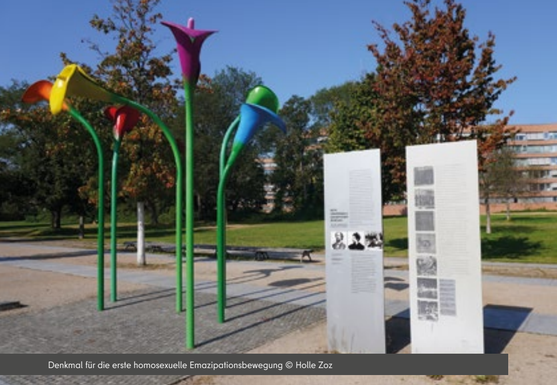
Denkmal für die erste homosexuelle Emanzipationsbewegung