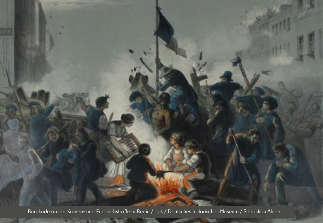
Barrikade an der Kronen- und Friedrichstraße in Berlin