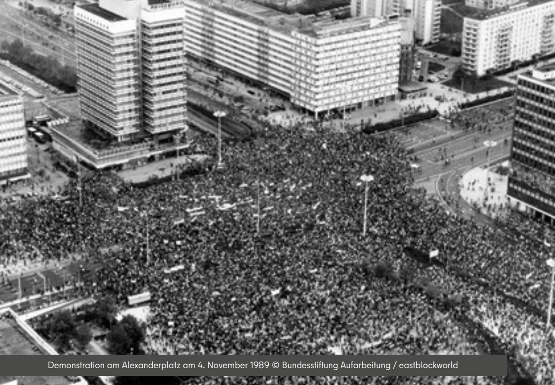
Demonstration am Alexanderplatz am 4. November 1989