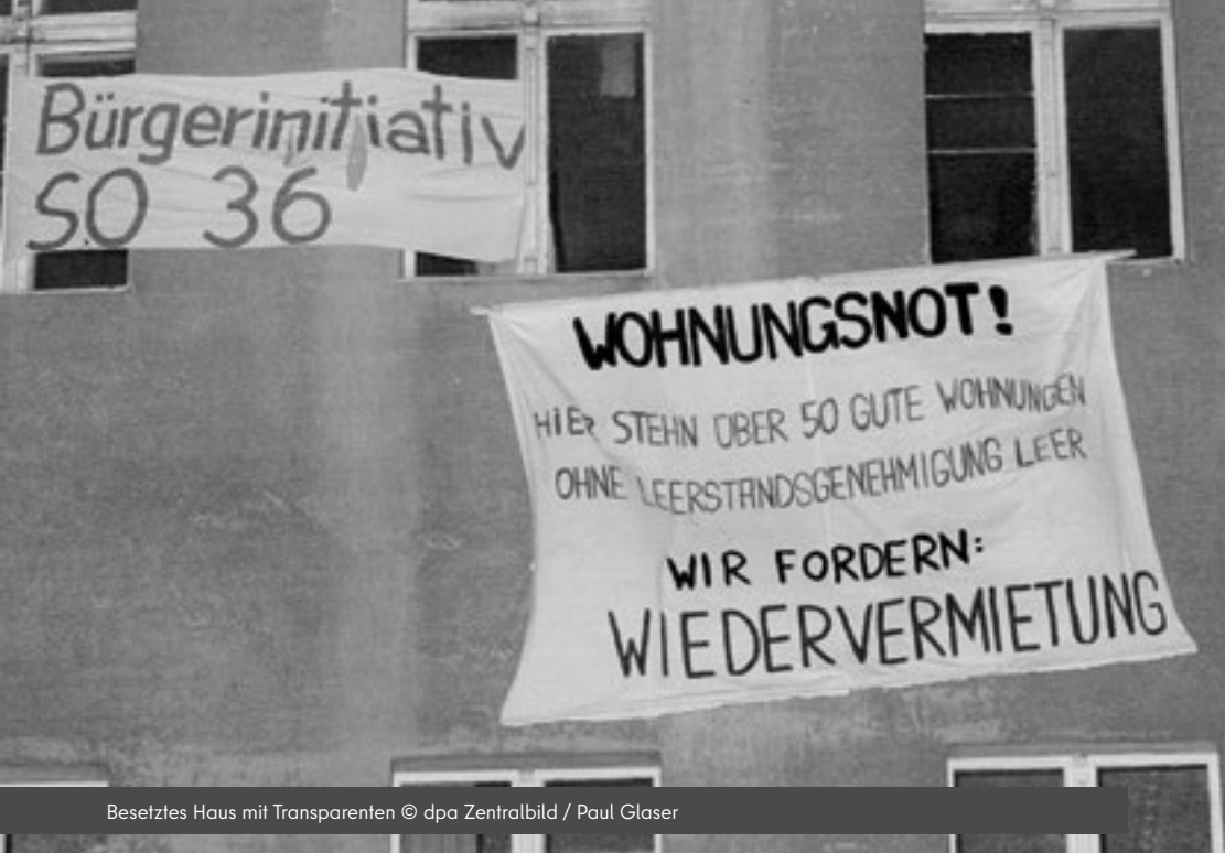
Besetztes Haus mit Transparenten