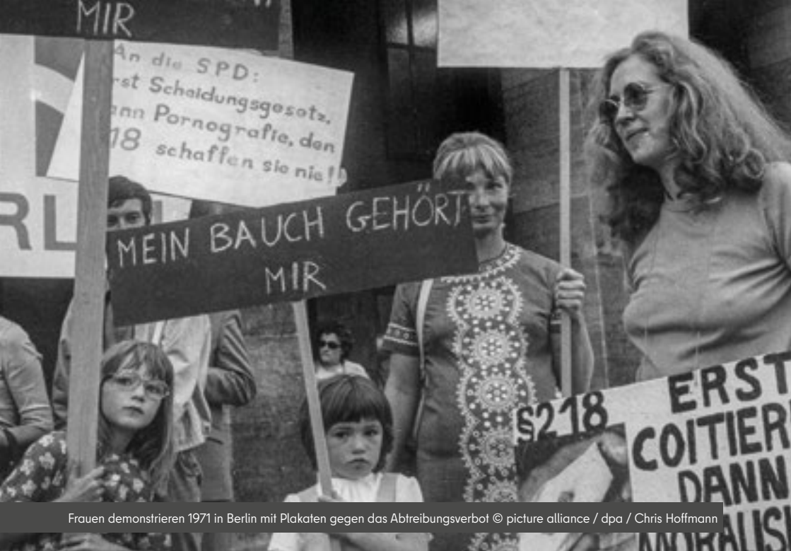
Frauen demonstrieren 1971 in Berlin mit Plakaten gegen das Abtreibungsverbot