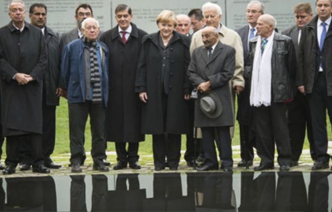
Eröffnung des Denkmals im Tiergarten