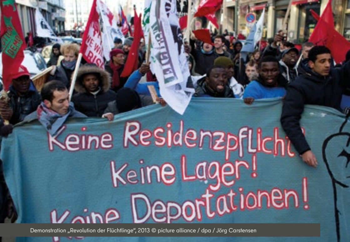
Demonstration „Revolution der Flüchtlinge“, 2013