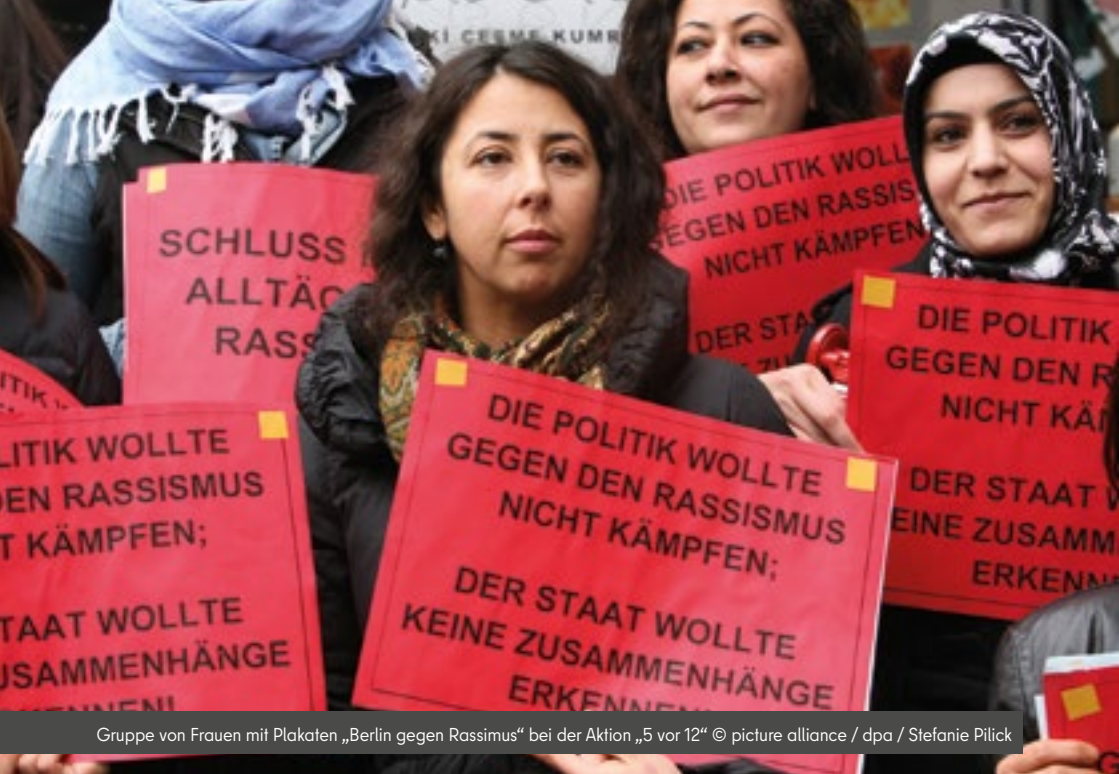
Gruppe von Frauen mit Plakaten „Berlin gegen Rassismus“ bei der Aktion „5 vor 12“