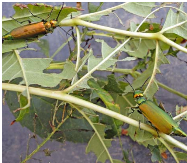
Abbildung 3: Lytta vesicatoria , adulte Käfer mit Fraßbild an Fraxinus excelsior