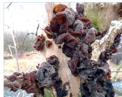
Abb. 2: Dachziegelartige Anordnung der Fruchtkörper des Judasohrs am Holunderstamm