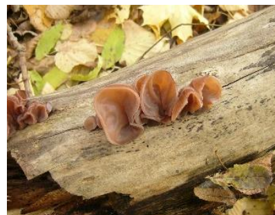
Abb. 1: Junge Fruchtkörper des Judasohrs am Eschenahorn