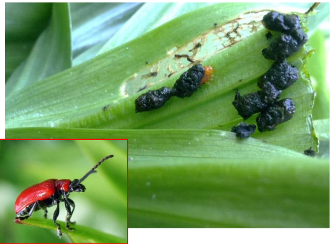
Käfer und Larven des Lilienhähnchens

Was auf den ersten Blick an den Blättern von Kaiserkronen oder Lilien wie ein Schnecken-schaden aussieht, kann auch eine andere Ursache haben. Löcher, abgefressene Blätter und dunkler Kot können auch vom Lilienhähnchen ( Lilioceris lili ) stammen. Zurzeit sind die auffälligen, roten Käfer, aber auch die gesellig fressenden Larven, zu finden. Diese sind orangerot, tarnen sich aber höchst effektiv dadurch, dass sie sich mit ihrem eigenen Kot verhüllen und so eher wie Nacktschnecken aussehen. Sie können erhebliche Blattschäden an Kaiserkronen, Lilien, Schachbrettblumen und sogar an Schnittlauch verursachen. Nach etwa einem Monat verpuppen sie sich im Boden und bilden in warmen Jahren eine zweite Generation aus.