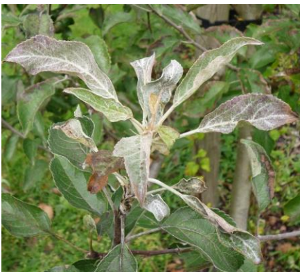
weißer mehlartiger Belag an jungen Blättern eines Apfelbaumes