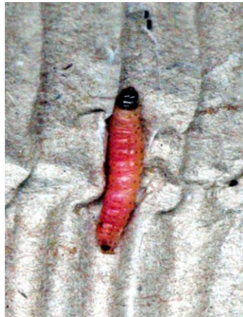
Larve in einem Wellpapperring