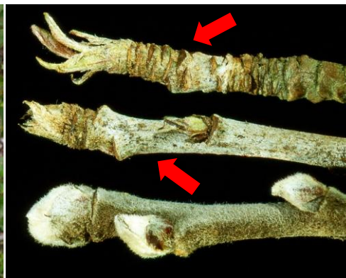
infizierte ausgefranzte Knospen