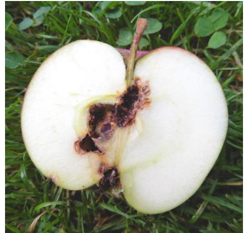
Schäden durch Bohrfraß an Apfel

Für den Freizeitgarten ist das Apfelwickler-Granulosevirus-Präparat (Handelsname „Madex Apfelwicklerfrei“) zugelassen (Stand Mai 2026). Bei der Anwendung gilt es folgendes zu beachten: