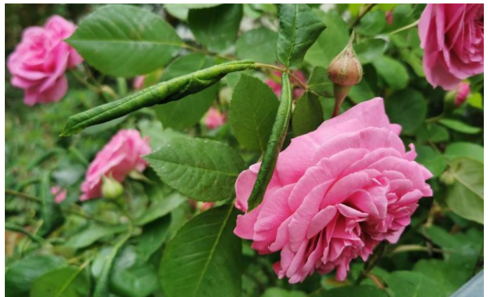
eingerollte Rosenblätter einer Strauchrose

Kontrollieren Sie Ihre Rosen regelmäßig und entfernen Sie befallene Blätter möglichst frühzeitig , um das Abwandern und Überwintern der Larven am Standort zu verhindern.