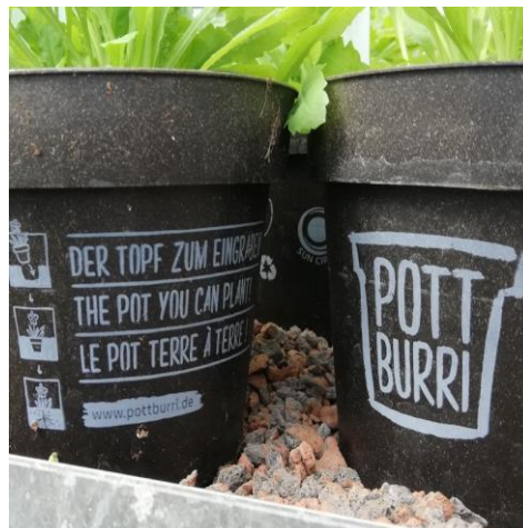
Beispiel für Kunststoffersatz: Töpfe aus Schalen der Sonnenblumenkerne zersetzen sich nach dem Einpflanzen oder können kompostiert werden.