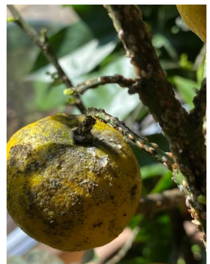
Verschmutzte Zitrusfrucht durch Ausscheidungen von Schildläusen