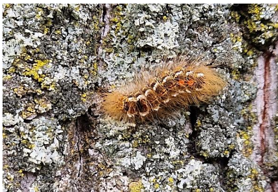
Abbildung 7: Larve des Goldafters

Darüber hinaus sind aktuell auch Larven des Goldafters ( Euproctis chryorrhoea ) recht mobil und teilweise auch am Boden umherwandernd. Aktuell stehen diese kurz vor der Verpuppung. Auch die Raupen des Goldafters (Abbildung 7) besitzen Brennhaare und verursachen bei Hautkontakt, ähnlich wie der Eichenprozessionsspinner, allergische Reaktionen. Daher sollen die Tiere nicht mit bloßen Händen angefasst werden.