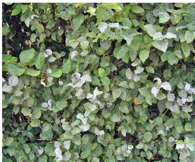
Abbildung 1: Echter Mehltau an einer Hainbuchenhecke

nazol, Tebuconazol und Kaliumhydrogencarbonat zur Verfügung. Wer ohne Pflanzenschutzmittel seine Pflanzen gesund erhalten möchte, hat die Möglichkeit, Pflanzenstärkungsmittel einzusetzen.