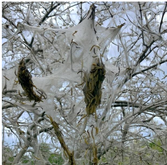
Abbildung 5: Starker Gespinstmottenbefall

Zurzeit erblickt man in Parkanlagen, auf begrünten Höfen, in Gärten oder am Straßenrand an verschiedenen Sträuchern stark eingesponnene Gehölzteile (Abbildung 5). Die Gespinstmottenaktivität ist je nach Standort unterschiedlich stark vorangeschritten. Von Anfangsfraß mit ersten Gespinnsten bis Kahlfraß. Im Inneren sind zahlreiche weißliche Raupen mit schwarzen Flecken zu finden. Auch bei Weißdorn sind die Gespinste der Weißdornmotte erkennbar. Sowohl die Raupen der Gespinstmottenarten als auch deren Gespinste sind für den Menschen völlig harmlos . Ein früher Befall lässt sich durch Rückschnitt gut eindämmen, später ist dies nicht mehr möglich – die Gehölze treiben bei ausreichender Wasserversorgung selbst bei Kahlfraß in der Regel wieder aus. Eine chemische bzw. biologische Pflanzenschutzanwendung ist aufgrund der Gespinste wenig zielführend, da die Raupen im Inneren der Gespinste gut geschützt sind.