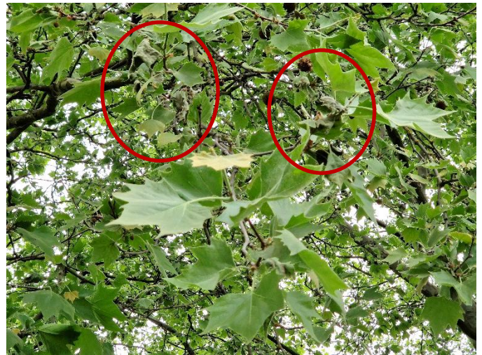
Abbildung 2: Welkes, herabhängendes Blattwerk in Platane (Kreise)

Insgesamt sind in diesem Frühsommer die Auswirkungen der Anthraknose aufgrund der kühlfeuchten Mai-Witterung auffällig. Es kann damit gerechnet werden, dass in den kommenden Wochen der Blattfall und somit die Kronenverlichtung an Platanen noch zunehmen wird. In der Regel wird der Schaden durch den Blattverlust im Laufe des Sommers durch den Neuaustrieb kompensiert , sodass keine nachhaltigen Schäden zu erwarten sind. Die alljährlich in unterschiedlicher Intensität auftretende Erkrankung wirkt sich meist nur gering auf die Vitalität der Platanen aus. Zur Unterstützung können dort, wo möglich, zusätzliche Wassergaben hilfreich sein.