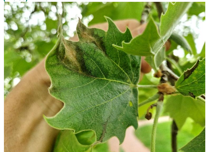
Abbildung 3: Schwärzliche Verfärbungen am Blattwerk