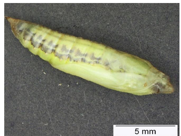
Abbildung 4: Puppe des Buchsbaumzünslers vor dem Schlupf zum Falter

Die Larven der überwinternden Generation haben sich größtenteils verpuppt und es kann mit dem Falterflug ab Anfang Juni gerechnet werden. Die Entwicklung der Larven zum Falter ist sehr temperaturabhängig, weswegen der Falterflug im Vergleich zum vergangenen Jahr verzögert starten wird. Wichtig! Die BT-Präparate ( Bacillus thuringiensis ) haben nur bei einem Einsatz im Junglarvenstadium eine ausreichende Wirkung und müssen von den Schadinsekten durch den Fraß aufgenommen werden, um zu wirken. Aus Sicht der guten fachlichen Praxis sind Pflanzenschutzmittelanwendungen vor dem Schlupf der neuen Larvengeneration auszusetzen. Eine ausführliche Übersicht zum Lebenszyklus der Raupen, dem Monitoring im Stadtgebiet (wöchentlich aktuelle Fangzahlen) und geeignete Bekämpfungsmaßnahmen entnehmen Sie bitte dem Internetauftritt Buchsbaumzünsler .