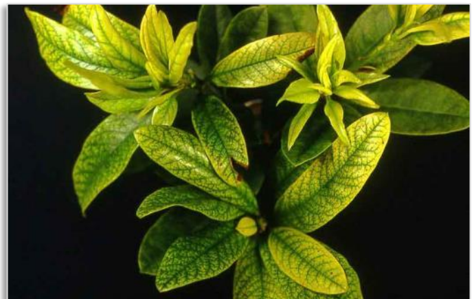
Abb. 3: Blattvergilbung (Chlorose) an Rhododendron

Doch gibt es auch Krankheiten, die durch einen Pilzbefall verursacht werden. Sie sind fast immer Folgeerscheinungen, die durch Schwächung der Widerstandskraft aufgrund von ungünstigen Standortverhältnissen oder als Folge einer nicht ausreichenden Ernährung an Rhododendron auftreten können. Insbesondere pilzliche Blattfleckererreger, die von der Blattspitze oder vom Blattrand ausgehen, verursachen unregelmäßige Flecke, die rotbraun bis aschgrau und dunkelbraun gerandet sind. Andere Blattfleckenkrankheiten haben dunkelbraune bis schwärzliche Flecke zur Folge, die unregelmäßig eckig und rötlich umrandet sind. Diese verschiedenen Blattfleckenkrankheiten, die gelegentlich bei ungünstigen Bedingungen auftreten, können mit den dafür zugelassenen Pilzbekämpfungsmitteln behandelt werden.