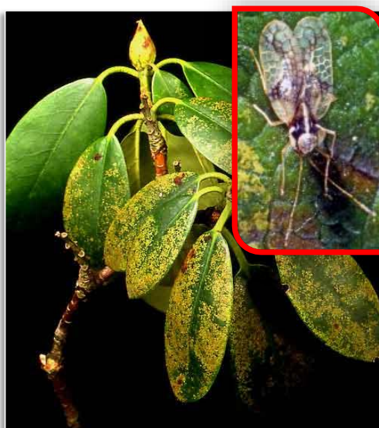
Abb. 8: Schaden durch Rhododendron-Netzwanzen

Die zur Bekämpfung der Krankheiten und Schädlinge an Rhododendron aktuell zugelassenen und erforderlichen Präparate können Sie beim Pflanzenschutzamt Berlin erfragen. Auch auf den Internetseiten des Bundesamts für Verbraucherschutz und Lebensmittelsicherheit (BVL) können Sie den aktuellen Zulassungsstand von Pflanzenschutzmitteln und die Anwendungsbestimmungen recherchieren: