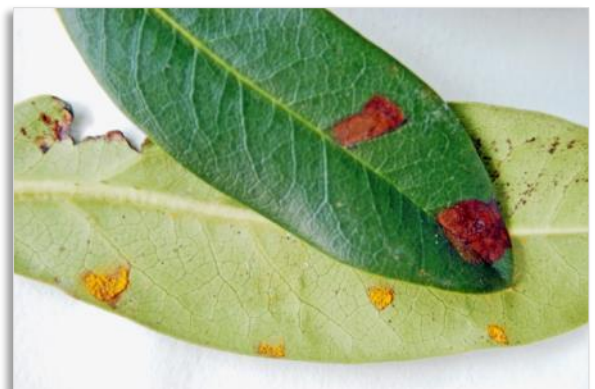
Abb. 4: Fichtennadelrost auf Rhododendron blättern

Vereinzelt können im Frühjahr an den Blattunterseiten und Trieben mit grüner Rinde orangefarbene, später stäubende Pusteln auftreten. Es handelt sich hier um den wirtswechselnden Fichtennadelrost ( Chrysomyxa rhododendri ) der im Frühsommer auf Fichten übergeht und hier erneut Sporenlager an den Nadeln bildet. Der Befall am Rhododendron ist offenbar sehr sortenabhängig. (Abb. 4)