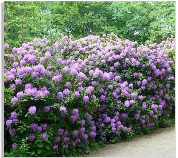
Abb. 1: Rhododendronblüte im Großen Tiergarten

Ausreichende Lichtverhältnisse sind für ein gesundes Wachstum und eine zufriedenstellende Blühhiligkeit von Bedeutung. In tiefem Baumschatten blühen Rhododendron geringer und sind im Wuchs zu locker. In lufttrockeneren Gebieten, wie z. B. im Berliner Raum, ist ein Standplatz im Schattenbereich von Gebäuden, besser noch im lichten Schatten größerer Gehölze anzuraten, wobei eine Beschattung in den heißen Mittagsstunden besonders wichtig ist, um Sonnenbrandschäden zu vermeiden. Als Schattenspende eignen sich Bäume mit tiefgehenden Wurzeln, z. B. Eichen, Zierkirschen, Eiben, Obstbäume, Rotdorn, Magnolien und Goldregen. Bei entsprechend weitem Abstand auch Tannen, Kiefern und Serbische Fichten. Andere Bäume wie Birke, Buche, Kastanie, Linde, Ahorn, Pappel und Weide sind als mögliche Konkurrenten zum Rhododendron weniger oder gar nicht geeignet. Zur Vermeidung von Wintertrockenschäden sollte ein windgeschützter Standort immer bevorzugt werden. Sonnenverträglicher sind vor allem die Yakushimanum -Hybriden,