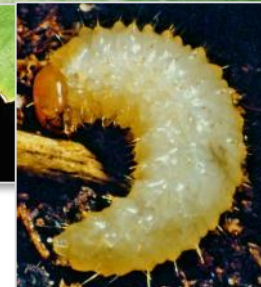
Abb. 7: Buchtenfraß durch Dickmaulrüssler rechts Käfer und Larve