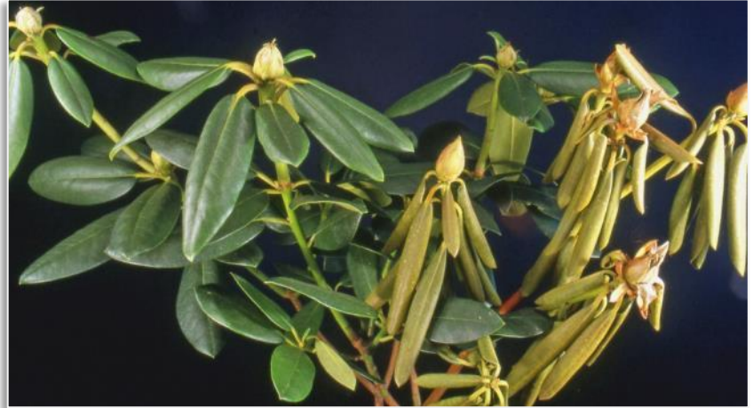
Abb. 5: Triebwelke an Rhododendron

Die Erfahrungen in der Beratung zeigen, dass in den meisten Fällen nichtparasitäre Ursachen (d. h. ungeeigneter Standort, zu hoher pH-Wert, falsche Pflanzung usw.) zu Schäden wie Chlorosen (Vergilbungen) und Nekrosen (braune Blattrandverfärbungen) an Rhododendron führen. Deshalb sollten die genannten Gesichtspunkte unbedingt beachtet werden. Einmal bei der Pflanzung gemachte Fehler können später nur äußerst schwierig oder gar nicht mehr ausgeglichen werden. Ein Rhododendron , der optimale Boden- und Umweltbedingungen hat, wird in der Regel weniger häufig von Krankheiten und Schädlingen befallen als andere Gehölze. Gute Standortbedingungen sind vorbeugender Pflanzenschutz. (Abb. 3)