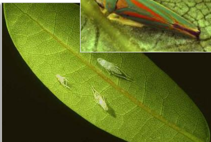
Abb. 6: infizierte Knospe (oben), Larven und Häutungsreste Adulte Rhododendronzikade (rechts)