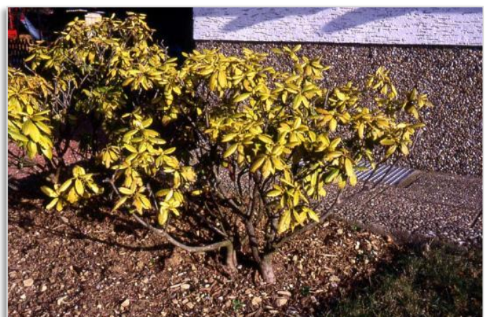
Abb. 2: Folgen eines ungeeigneten Standortes