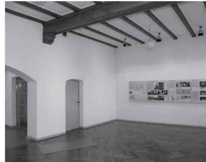
Der Ausstellungsraum im sog. Betsaal ist den Opfergruppen und den Folgen der Gewalttaten gewidmet, während sich die Ausstellungsmodulare in den ehemaligen Zellen mit der Nachgeschichte der Köpenicker Ereignisse beschäftigen.