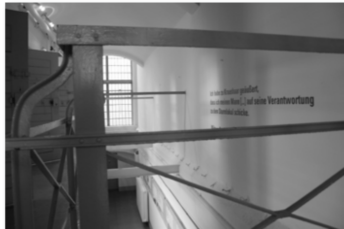
Der Blick in den Zellengang vermittelt einen Eindruck von der einstigen Funktion des Gebäudes als Gefängnis.