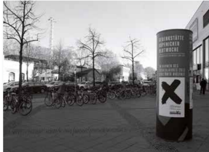
Im 2013 durchgeführten Themenjahr „Zerstörte Vielfalt 1933-1938-1945“ hat eine Infosäule auf die Gedenkstätte hingewiesen.